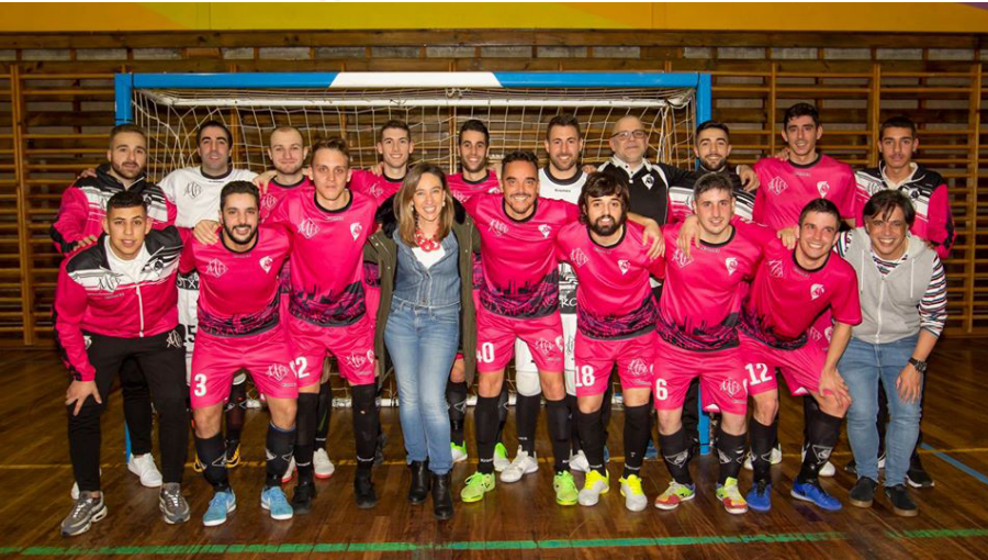
Plantilla del Otxartabe 2019-2020