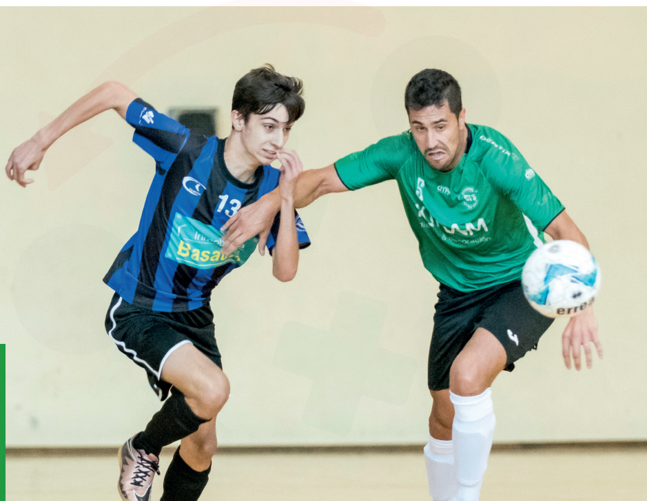
Partido de Copa Vasca entre en Basauri

ARETO FUTBOLEKO EUSKAL BATZORDEA | COMITÉ VASCO DE FÚTBOL SALA | ARETO FUTBOLEKO EUSKAL BATZORDEA | COMITÉ VASCO DE FÚTBOL SALA