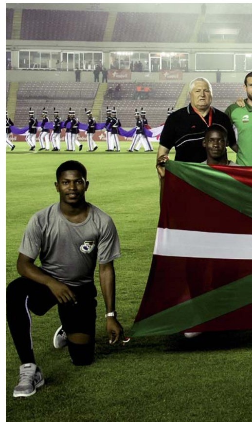
La plantilla de la selección vasca, en Panamá