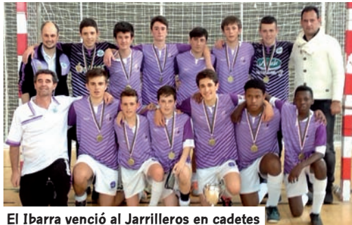
El Ibarra venció al Jarrilleros en cadetes