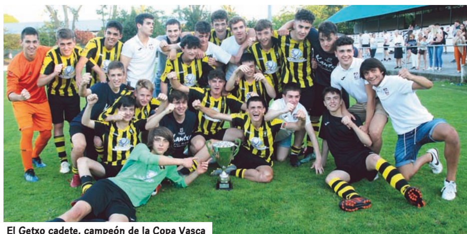
El Getxo cadete, campeón de la Copa Vasca