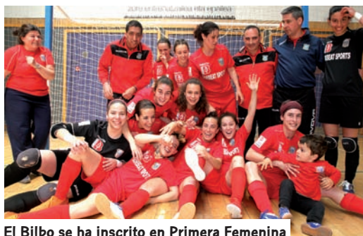
El Bilbo se ha inscrito en Primera Femenina