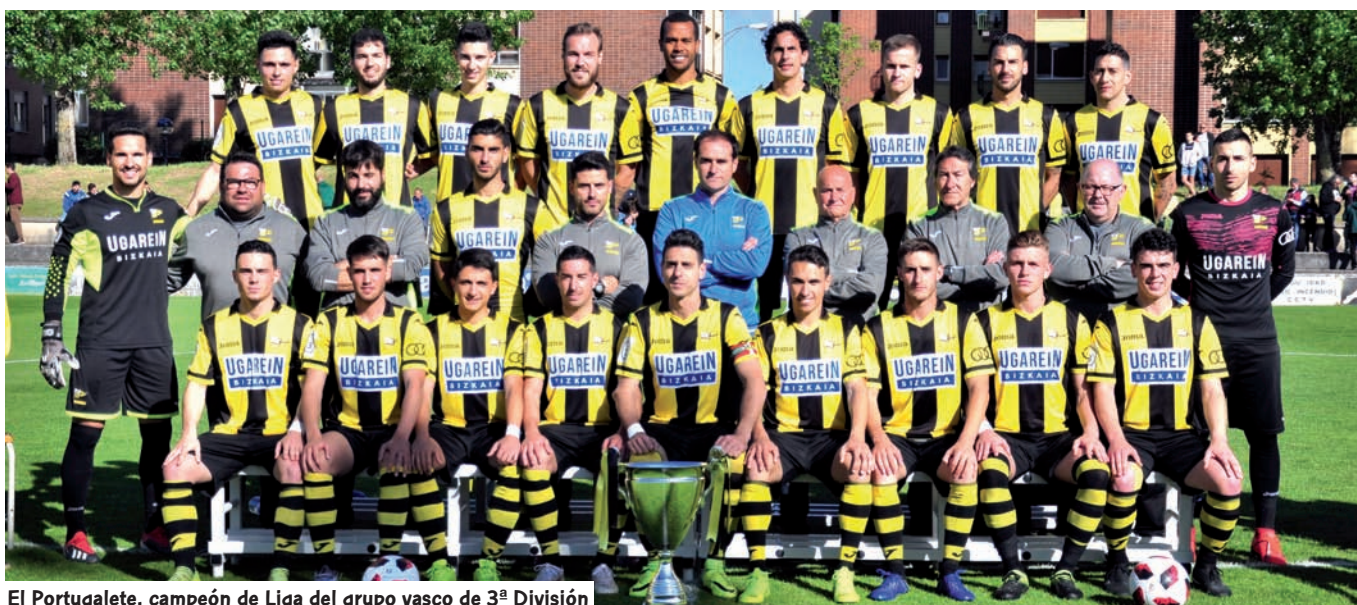
El Portugalete, campeón de Liga del grupo vasco de 3ª División

Grupo IV de Tercera en la promoción fue el San Ignacio, quien en su debut en estas lides, no pudo pasar de la primera ronda. Los alaveses perdieron precisamente contra el verdugo del River, la escuadra asturiana que se impuso en Miramar 2-0 tras igualar sin goles en Ibaia.