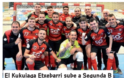
El Kukuiaga Etxebarri sube a Segunda B

El Elorrietako ha sido uno de los equipos más destacados de la temporada. Recién ascendido, su falta de experiencia no ha sido un problema puesto que se ha adaptado a la perfección a la nueva categoría. Y además ha hecho doblete con la Copa. Los de Bilbao renunciaron a la plaza de ascenso, que finalmente ha sido para el Kukuiaga Etxebarri, que jugará en Segunda B. Con idéntico número de puntos, el Gernikako ha logrado proclamarse campeón en Liga Vasca. Un equipo que ya luchó el año anterior por el ascenso.