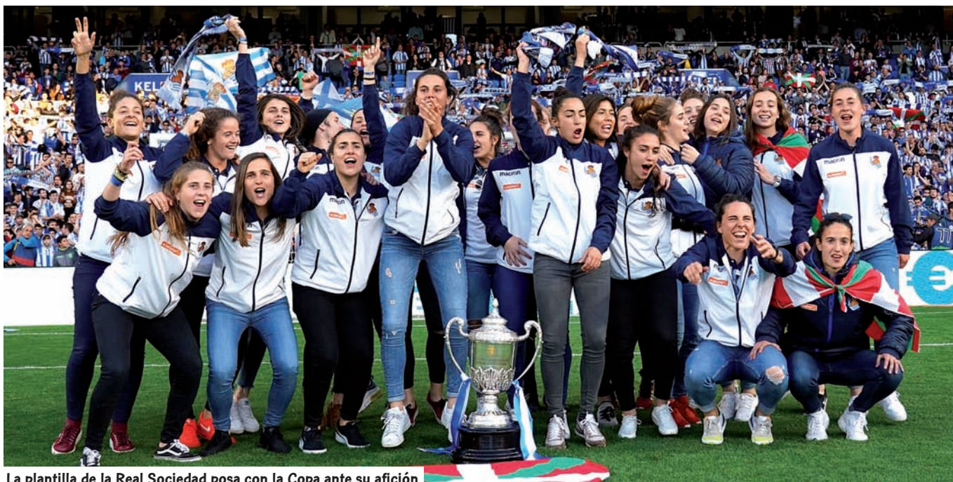
La plantilla de la Real Sociedad posa con la Copa ante su afición