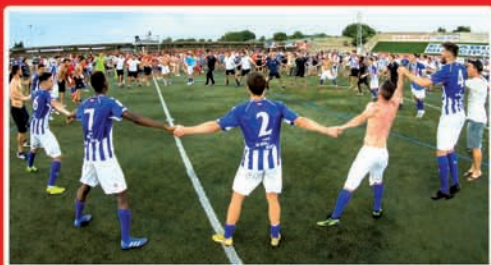
EL ALAVÉS B ASCIENDE A SEGUNDA DIVISIÓN B