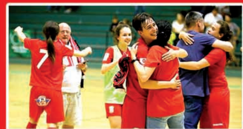
EL BILBO FÚTBOL SALA SUBE A 1ª FEMENINA