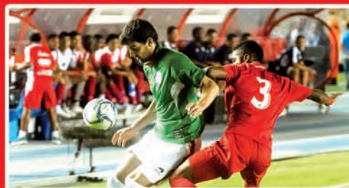
LA EUSKAL SELEKZIOA PLANTA CARA A PANAMÁ