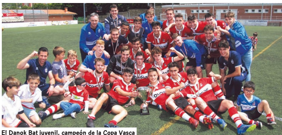
El Danok Bat juvenil, campeón de la Copa Vasca

En categoría cadete el triunfo fue para el Getxo, que jugó la Final en casa con un Alavés que, además, se adelantó en el marcador. Los vizcaínos empataron en el último suspiro de penalti y el 1-1 con el que finalizó el tiempo reglamentario dio paso a los lanzamientos desde los once metros para dilucidar el nombre del Campeón. El Getxo estuvo más fino con los disparos y se llevó el triunfo coronándose como Campeón.