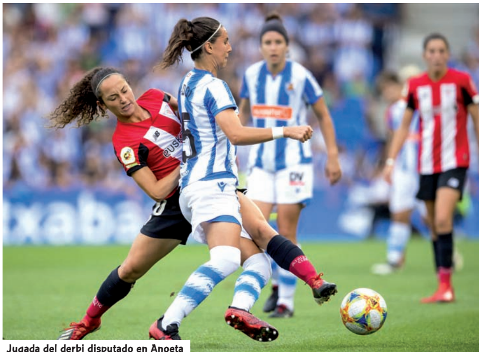
Jugada del derbi disputado en Anoeta