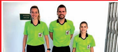
DOS MUJERES ÁRBITRO FORMAN EQUIPO EN 3ª