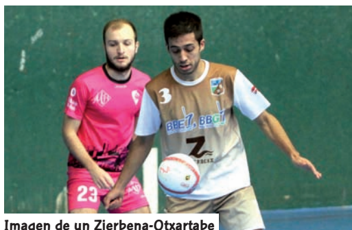
Imagen de un Zierbena-Otxartabe

Entre los equipos vascos de Segunda B destaca el resurgimiento del Zierbena de la mano de Aitor Larrea, la buena temporada del Otxartabe y Lauburu Ibarra, mientras que el Laskorain se encuentra en la zona media de la clasificación y el