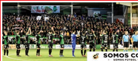
EL FÚTBOL VASCO DISFRUTA CON LA COPA