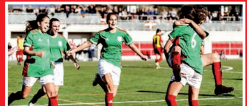
LEZAMA ACOGIÓ EL ESTATAL FEMENINO