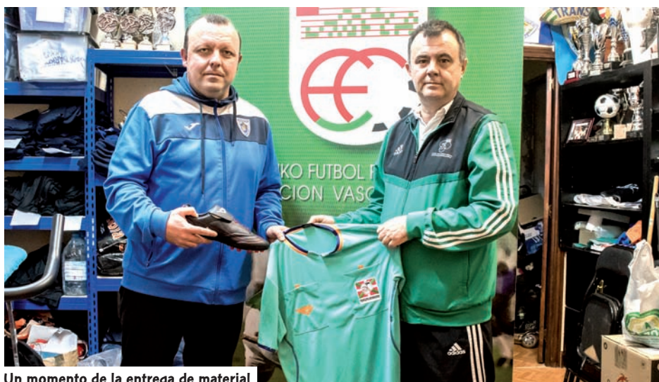
Un momento de la entrega de material

Para conocer con mucha mayor profundidad la actividad que realiza esta ONG puedes acceder a su web www.deporteydesarrollo.org .