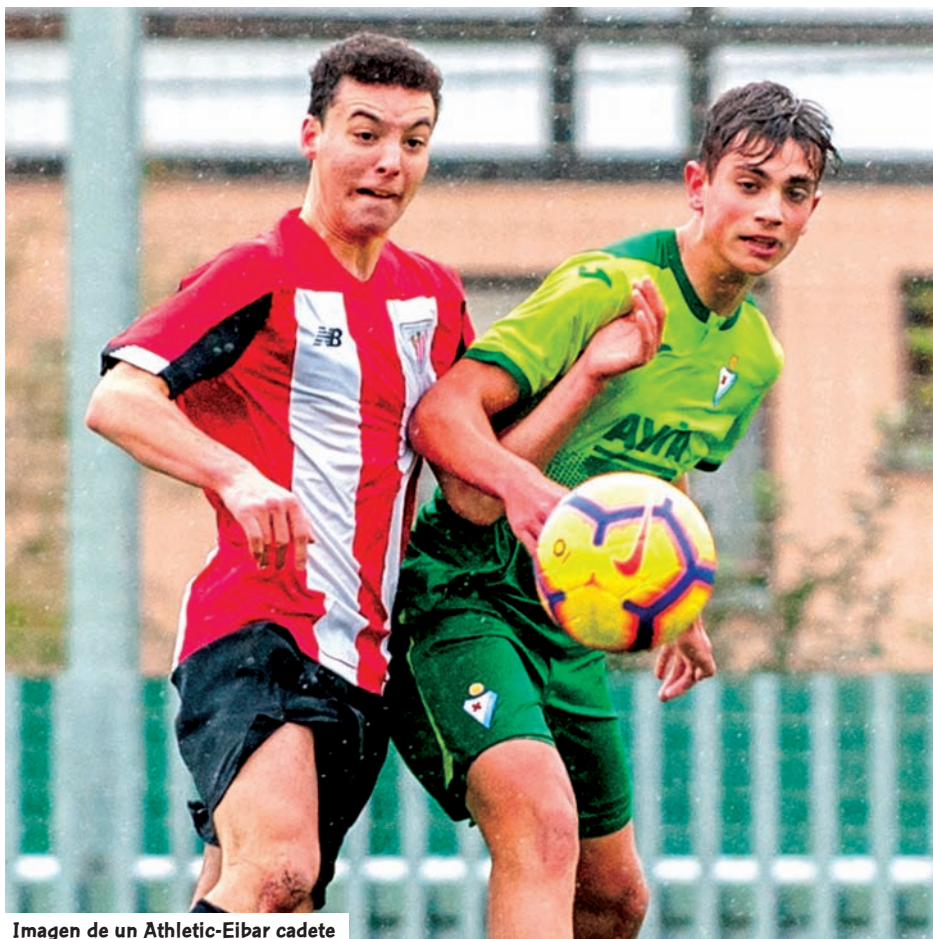
Imagen de un Athletic-Eibar cadete

En Liga Vasca Cadete el Athletic Club ha mantenido un intenso mano a mano con el Antiguoko durante la primera vuelta de la Liga. Estos dos equipos han eclipsado un poco el magnífico trabajo del Eibar, escuadra que se ha instalado durante muchas semanas en la tercera posición por delante de dos de los grandes clubes vascos, la Real Sociedad y el Alavés. El Danok Bat intenta meterse en el grupo de los cinco primeros de la tabla. Al igual que en Liga Vasca Juvenil, los cadetes afrontan este año 34 jornadas.