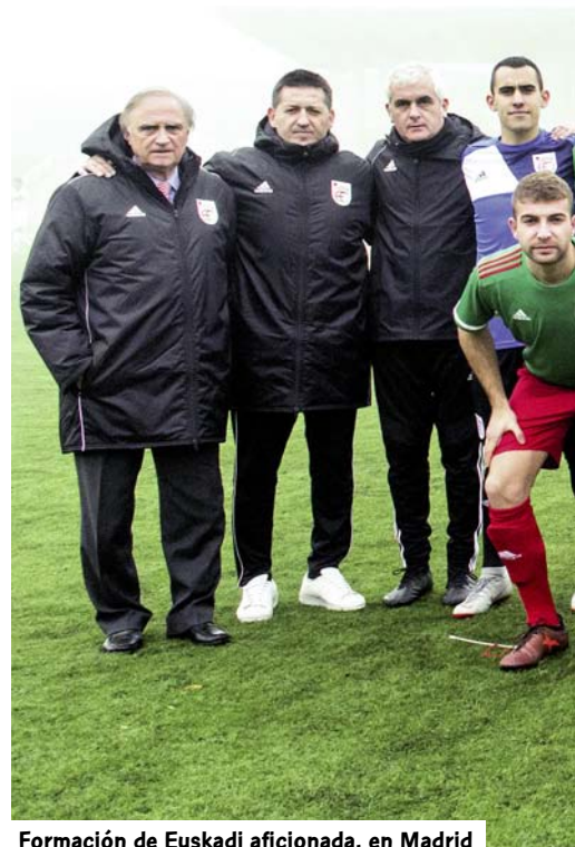
Formación de Euskadi aficionada, en Madrid