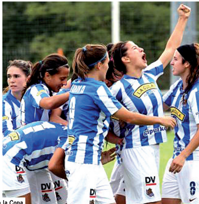
Las leonas luchan por conquistar su quinto título, la Real por un puesto en la Copa