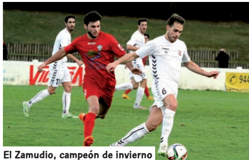
El Zamudio, campeón de invierno

El Zamudio se proclamó campeón de invierno en el grupo vasco de Tercera División por delante de Balmaseda, Lagun Onak y Vitoria.