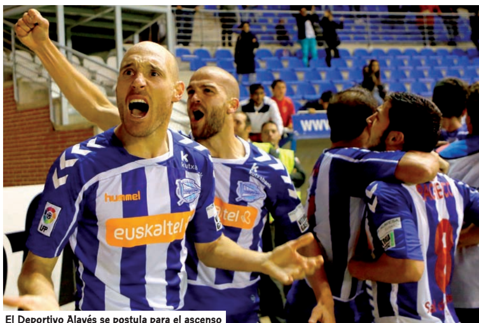
El Deportivo Alavés se postula para el ascenso

las últimas nueve temporadas, el líder a estas alturas consiguió después el ascenso directo al final del curso. Así ocurrió con Las Palmas