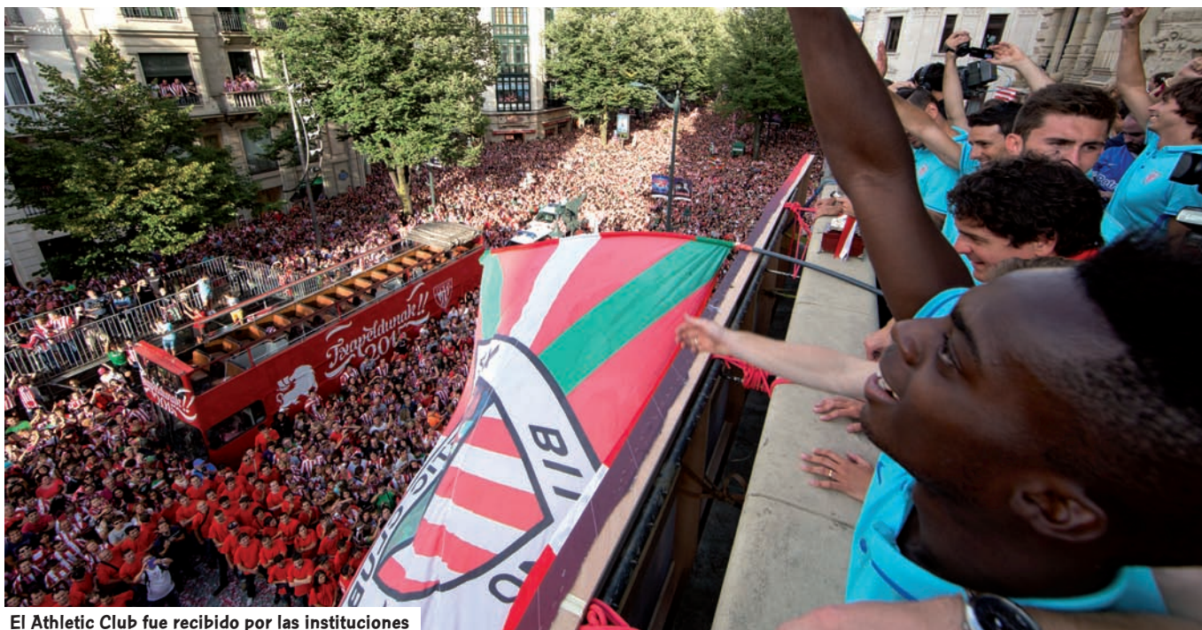
El Athletic Club fue recibido por las instituciones