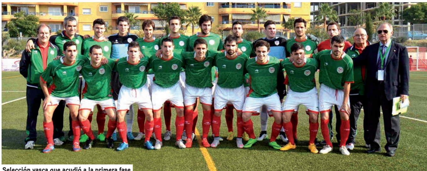
Selección vasca que acudió a la primera fase