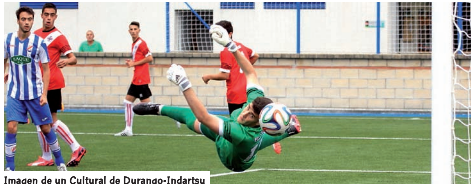
Imagen de un Cultural de Durango-Indartsu

El Athletic Club lidera la clasificación de la Liga en la máxima categoría juvenil. En una temporada en la que la Real Sociedad no está brillando en cuanto a resultados se refiere son los bilbaínos los que están dominando la competición