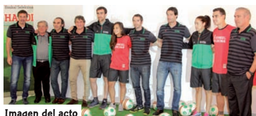
Imagen del acto

La marca deportiva Astore homenajeó a finales del pasado mes de octubre a tres generaciones de la Euskal Selektzioa, en su 100 aniversario.