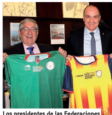
Los presidentes de las Federaciones