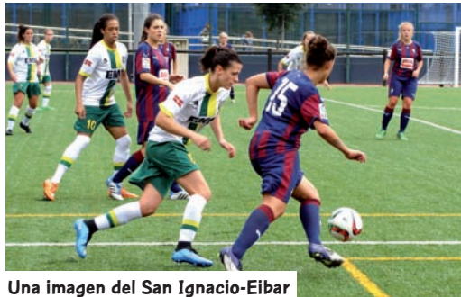
Una imagen del San Ignacio-Eibar

Ocho son nuestros representantes en la Segunda División. El campeonato de Plata divide a las nuestras en dos objetivos: Título y permanen-