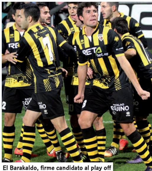
El Barakaldo, firme candidato al play off

los equipos castellano-manchegos, madrileños, aragoneses o canarios tan sólo el Portugalete ocupaba plaza de descenso tras 21 semanas.