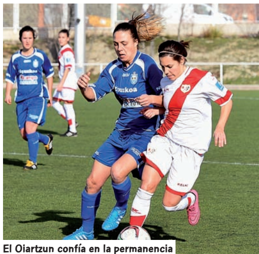
El Oiartzun confía en la permanencia