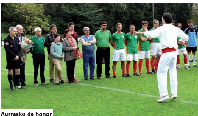
Auresku de honor