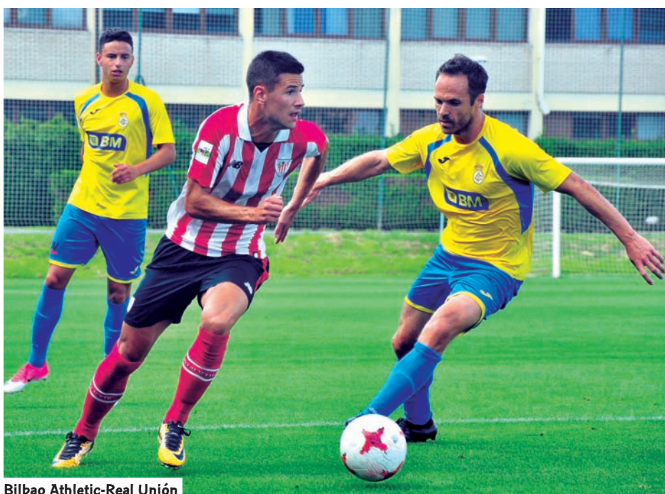
Bilbao Athletic-Real Unión

La primera vuelta finalizó sin conjuntos vascos en puestos de descenso pero con el Real Unión rondando la zona de promoción (tendría que disputar una eliminatoria a doble partido para evitar caer a 3ª) y con Vitoria y Arenas en posiciones comprometidas.