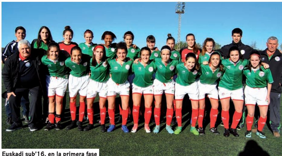
Euskadi sub'16, en la primera fase

Los dos equipos ya piensan con ilusión en sus siguientes enfrentamientos de la segunda fase. Todo parece indicar que se medirán a Cantabria y Castilla La Mancha en tierras cántabras. La cita será del 9 al 11 de febrero.