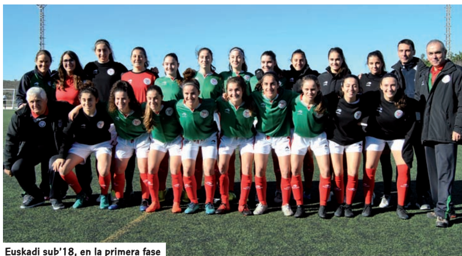
Euskadi sub'18, en la primera fase