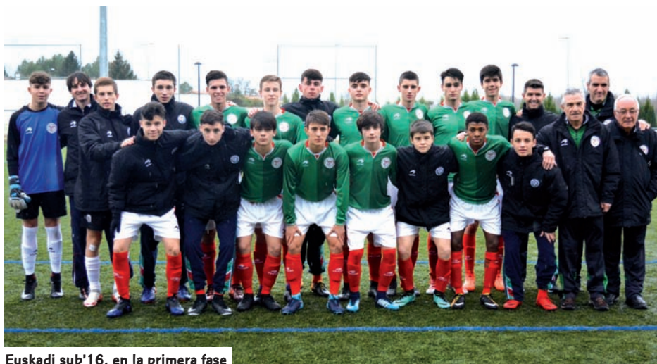
Euskadi sub'16, en la primera fase

Con estos resultados, y de cara a la segunda fase, los juveniles dependen de sí mismos y los cadetes tienen que ganar sus dos partidos y quizás esperar algún otro resultado.