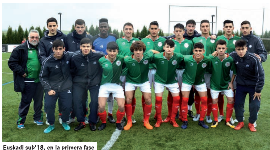
Euskadi sub'18, en la primera fase