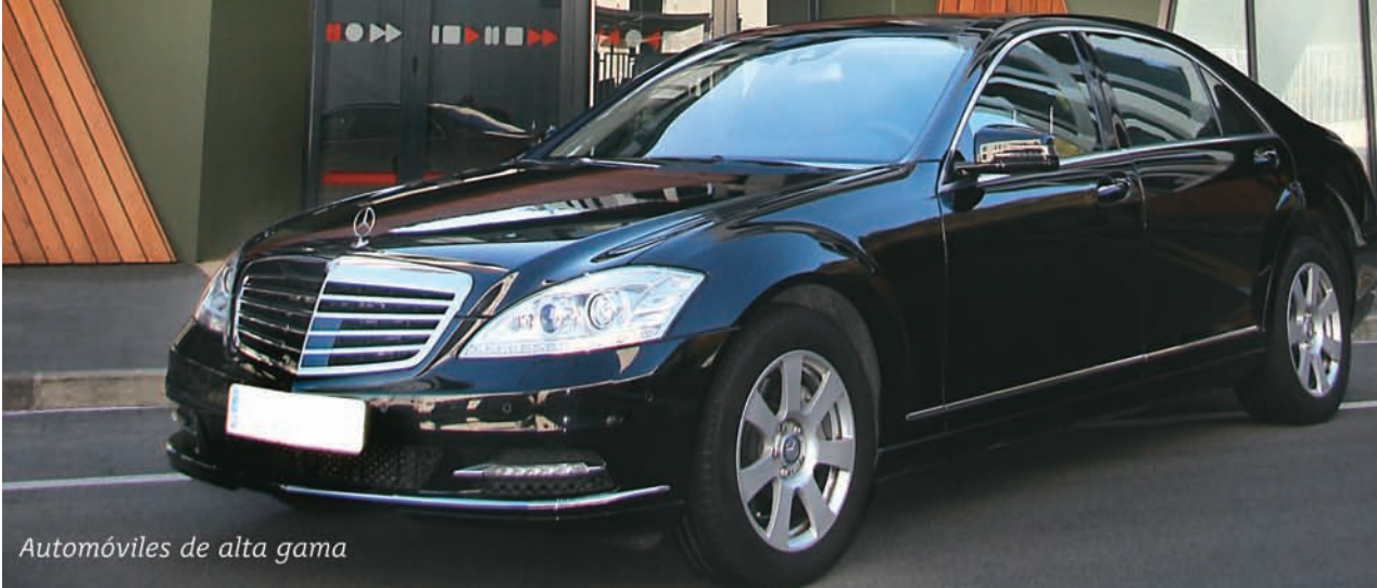
Automóviles de alta gama