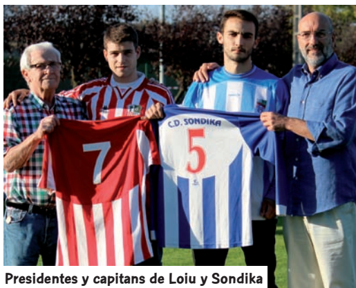
Presidentes y capitanes de Loiu y Sondika

Año de celebraciones para distintos equipos vascos. El CD Sondika conmemoró el pasado mes de septiembre su 75º aniversario con una serie de actos, entre ellos el homenaje al equipo juvenil del 62, al conjunto femenino -pionero en jugar la Primera División femenina- y al equipo que ganó la Copa Bizkaia, en 1972, además de una comida popular y varias actua-