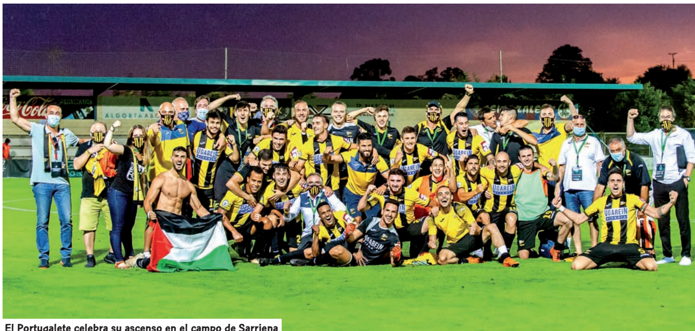
El Portugalete celebra su ascenso en el campo de Sarriena