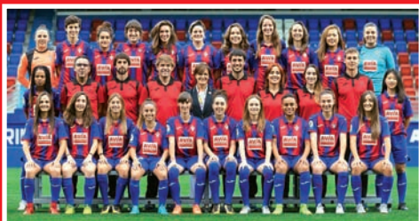
LA SD EIBAR ASCIENDE A 1ª DIVISIÓN FEMENINA

REAL SOCIEDAD Y ATHLETIC CLUB SE DISPUTARÁN EL TÍTULO DE COPA