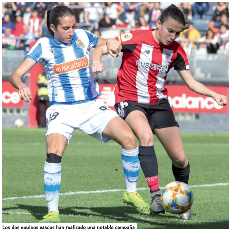
Los dos equipos vascos han realizado una notable campaña