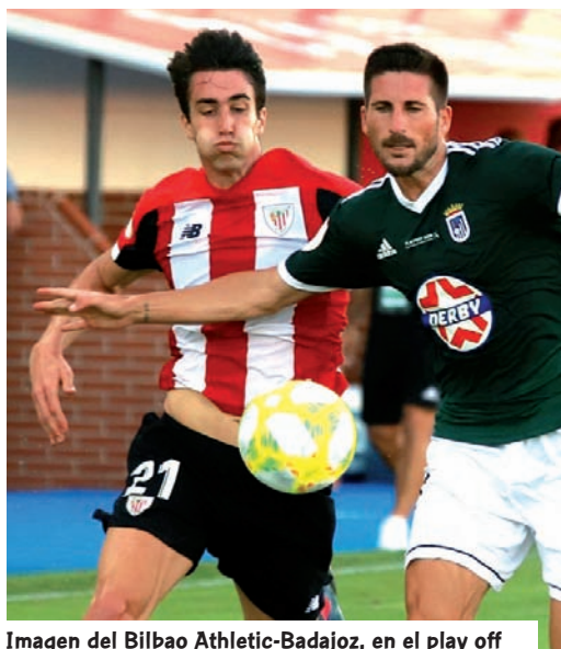
Imagen del Bilbao Athletic-Badajoz, en el play off

El Bilbao Athletic, que disputó su cuarto play off de ascenso en los últimos ocho años, fue el mejor de los equipos vascos del Grupo II de Segunda División B después de que la Federación Española diese por finalizada la fase regular de la Liga 2019/20 tras la disputa únicamente de 28 jornadas debido a la pandemia. Esa decisión federativa dejó a Sanse y Amorebieta con la miel en los labios, dado que para entonces donostiarras y azules