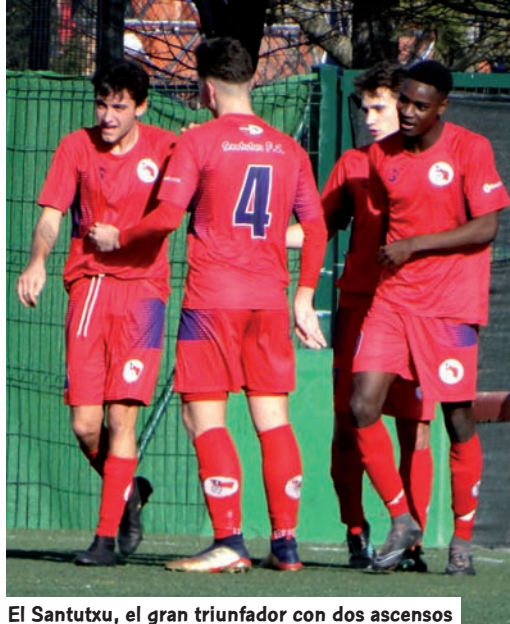
El Santutxu, el gran triunfador con dos ascensos

El Santutxu ha sido el club de categoría juvenil que más premio ha tenido en esta irregular temporada. El club bilbaíno ha conseguido ascender a sus dos primeros equipos juveniles. Uno a División de Honor y el otro a Nacional. Mientras, también han tenido premio el Aurrera de Vitoria, que jugará en la élite juvenil, así como el Alavés B, primer clasificado en Liga Vasca y el Indartsu de Basauri, tercero, que competirán ambos en la categoría