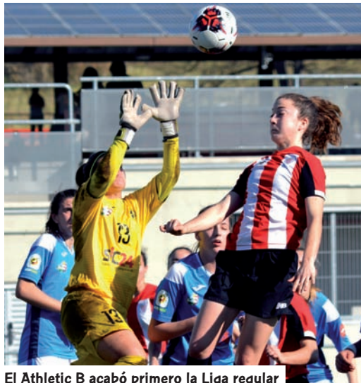
El Athletic B acabó primero la Liga regular

La Segunda División, también conocida como Reto Iberdrola, ha tenido sin duda claro color vasco, y tan sólo el filial del Barcelona se ha