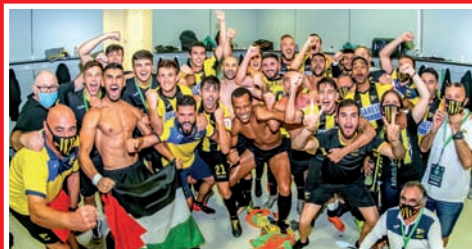
EL PORTUGALETE SUBE A 2ªB EN EL PLAY OFF EXPRES