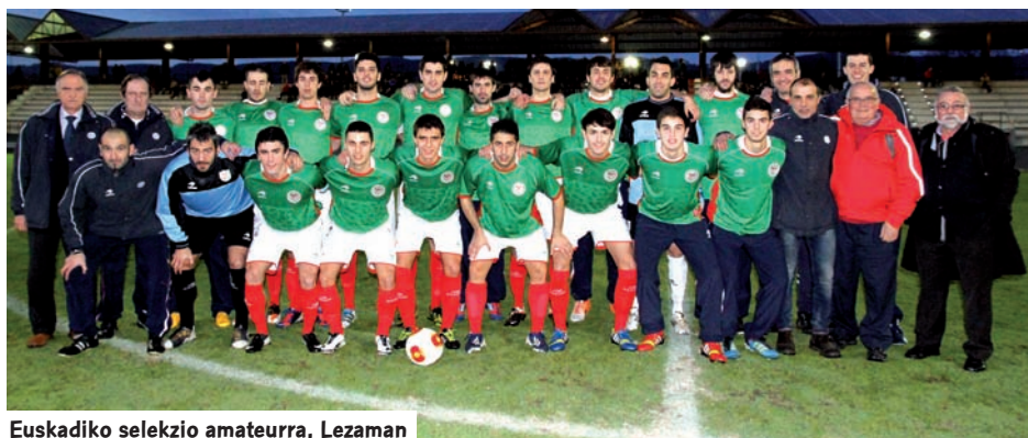
Euskadiko selekzio amateurra, Lezaman

E uskal selekzio amateurra kanporatua izan zen Eskualdetako UEFA Koparen estatu faseari zegokion bitarteko txandan, Gaztela eta Leonen aurka kikildu ez izan arren, zeinek Euskadik bezala, jadanik nazioarteko metalarekin kontatuko duen bere beira-arasetan.