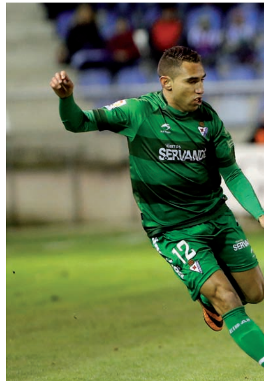
Eibar eta Alaves, der biaren irudi batean

Euforia une horietan teknika-riaren diskurtsoa erabakigarria izan zen gogorarazi nahian kluba Bigarren Mailako aurrekontu