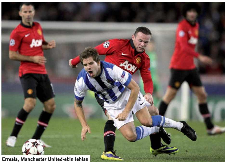
Errealak, Manchester United-ekin lehiatzen