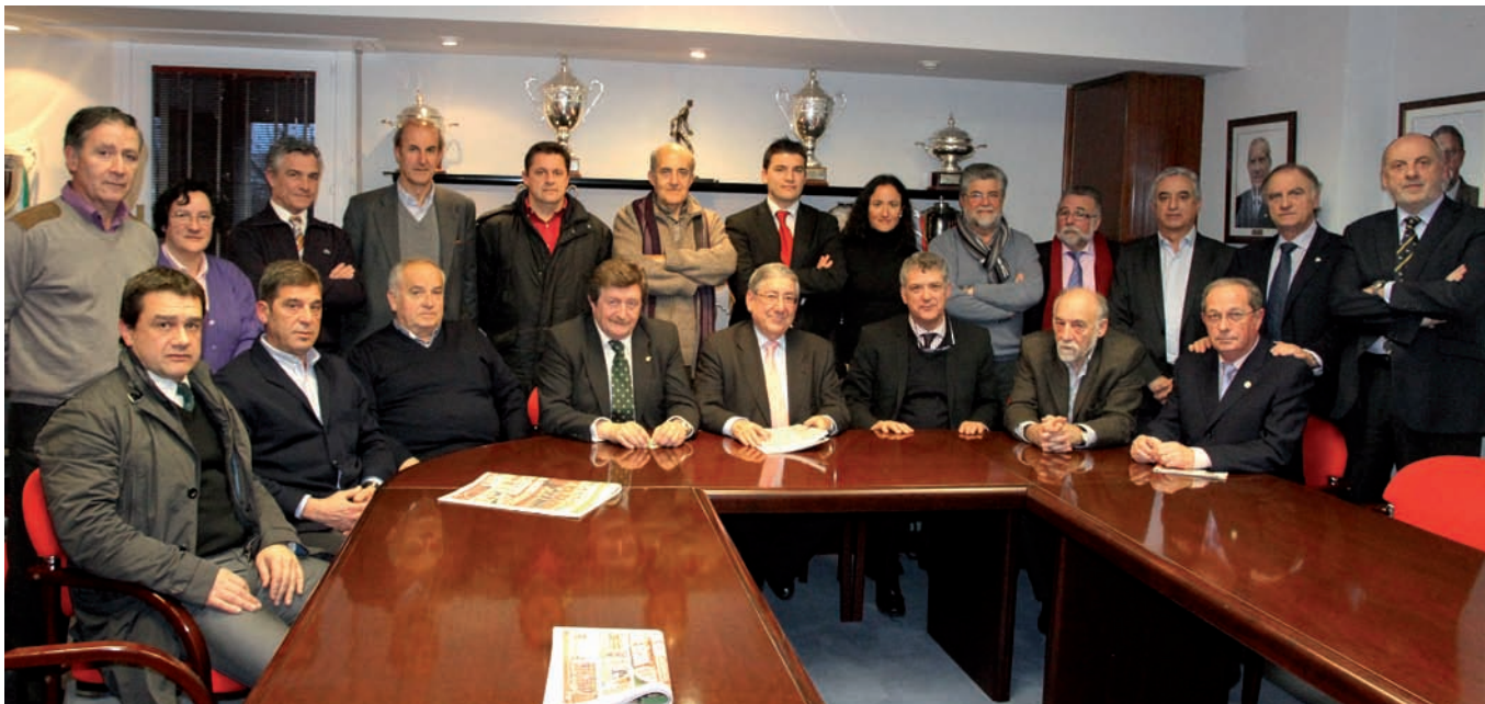
Euskadiko federazioko egungo Zuzendaritza Batzordea, Angel Maria Villar Espainiako Federazioko presidentearekin, jendaurreko aurkezpen egunean