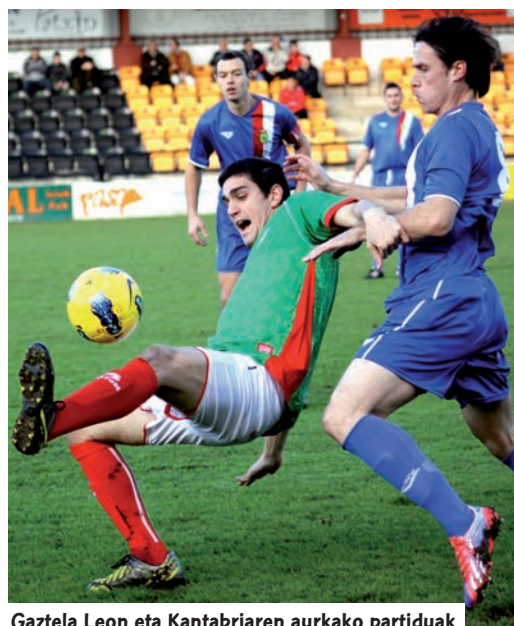
Gaztela Leon eta Kantabriaren aurkako partiduak