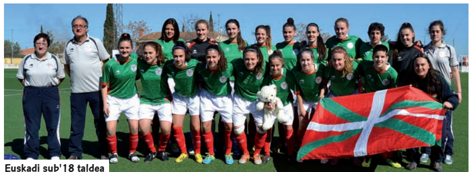
Euskadi sub'18 taldea

renen mendean jardun zenez, ezin izan zen gailendu. Dena den, joko eta portaera ezin hobek izan ziren.