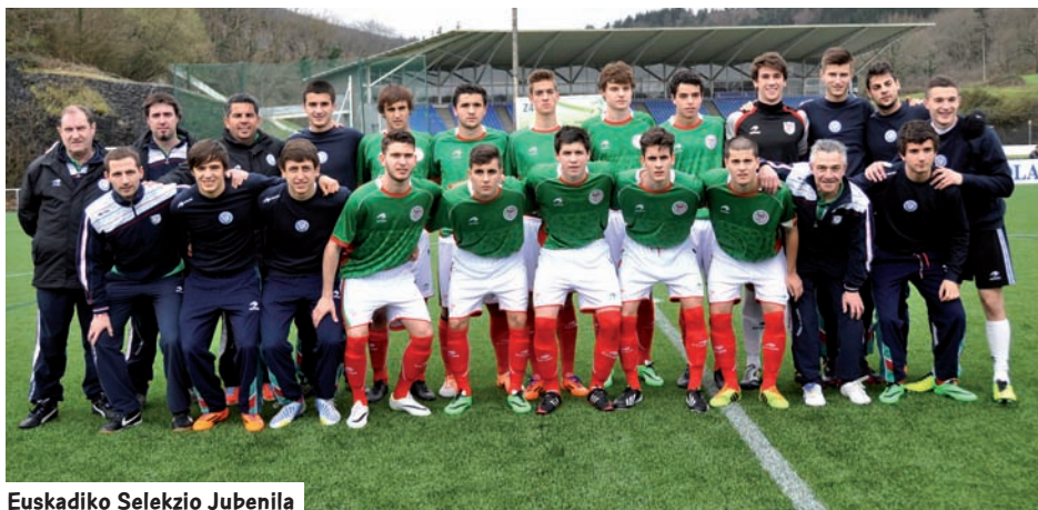
Euskadiko Selekzio Jubenila