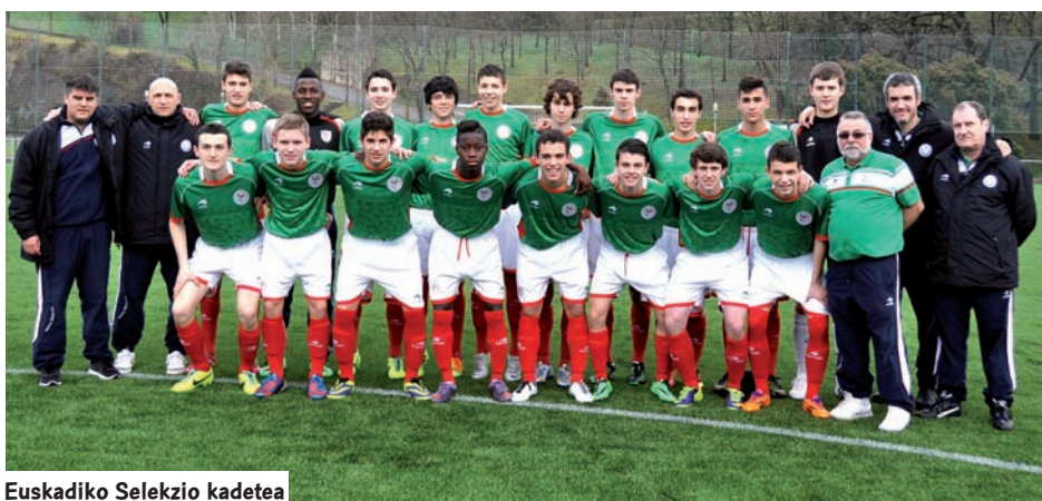
Euskadiko Selekzio kadetea