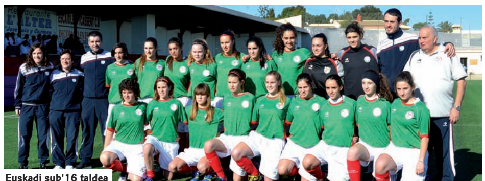
Euskadi sub'16 taldea