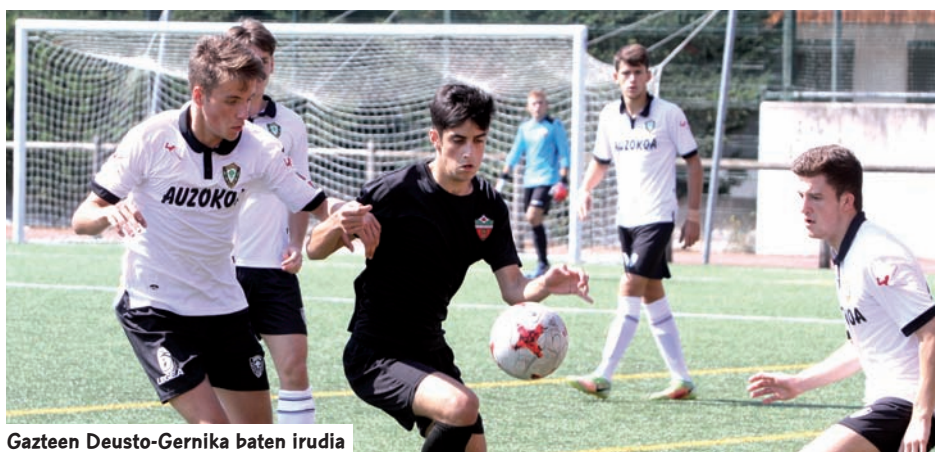
Gazteen Deusto-Gernika baten irudia

Gernika, Lakua eta Betoño dira ez jaisteko borrokatzen ari diren ekipoak.