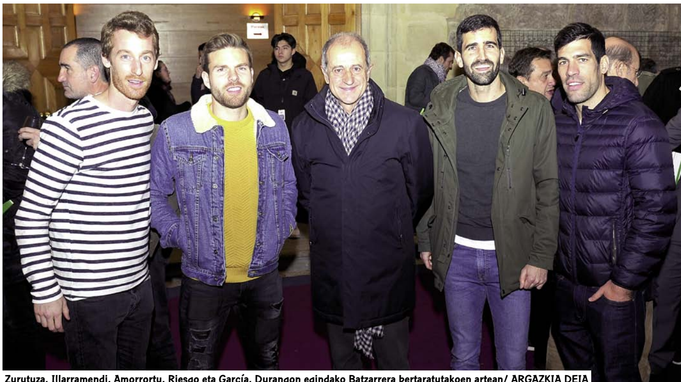
Zurutuza, Illarramendi, Amorrortu, Riesgo eta García, Durangon egindako Batzarrera bertaratutakoen artean