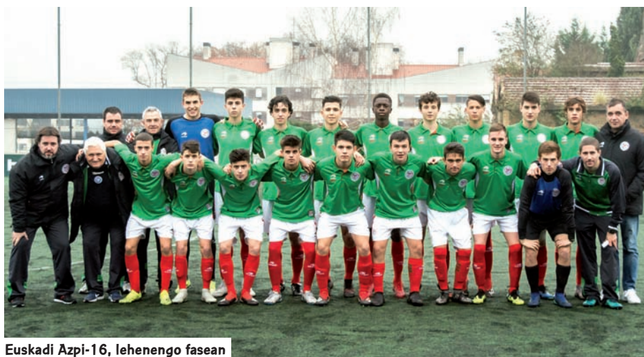
Euskadi Azpi-16, lehenengo fasean