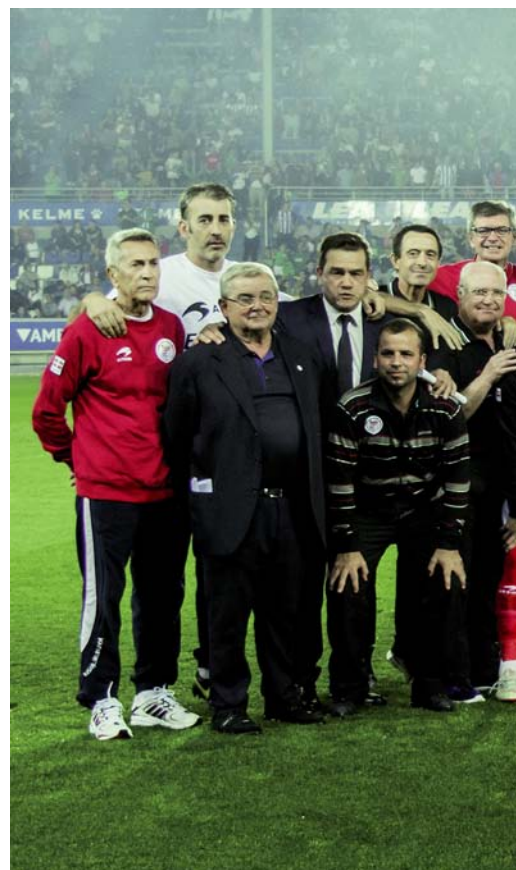
Euskal selekzioaren jokalariek, Mendizorrozan