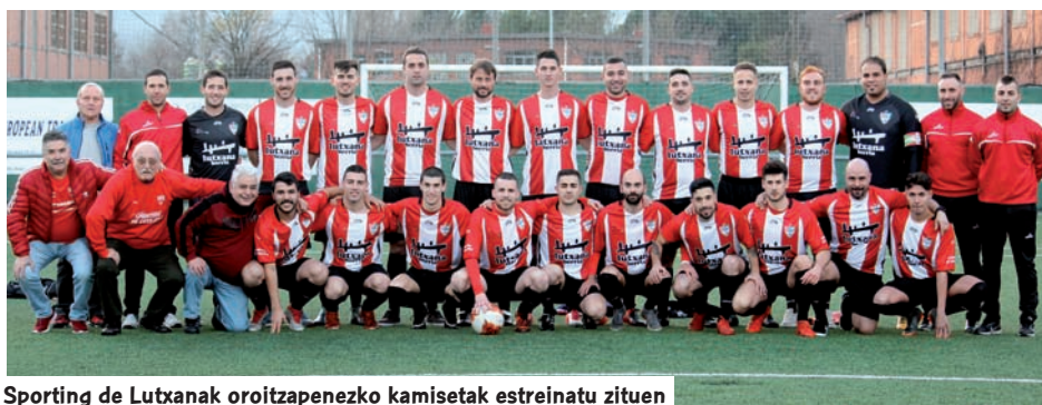
Sporting de Lutxanak oroitzapenezko kamisetak estreinatu zituen

to, Zorroza, Erandio, Real Unión, Sestao (bi deiturekin), Barakaldo, Elgoibar eta Santutxu.