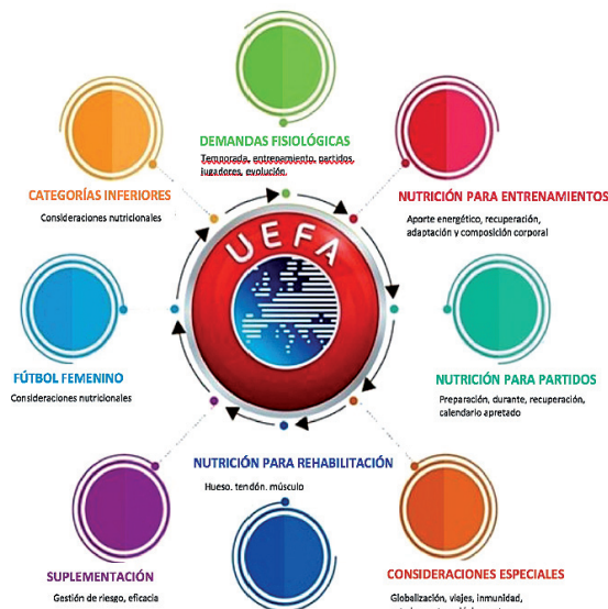
“Futboleko Nutrizio Akordioa 2018” Kirol-nutrizioa

Azken urteotan futbolak eboluzionatu duen modu berean, nu-