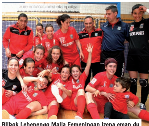
Bilbok Lehenengo Maila Femeninoan izena eman du