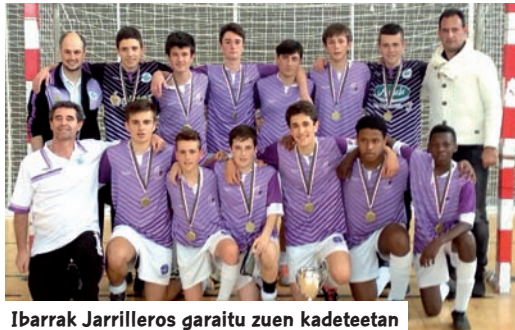
Ibarrek Jarrilleros garaitu zuen kadeteetan

Lauburu Ibarrek Jarrillerosi irabazi zion kadeteen kategorian, eta Ordiziak Stilori emakumezkoen kategorian.