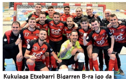
Kukuiaga Etxebarri Bigarren B-ra igo da

E lorrietako denboraldiko ekiporik gailenetako bat izan da. Igo berria izan arren, eskarmentu falta ez da oztopo izan, kategoria berrira bikain egokitu baita. Eta gainera garaipen bikoitza izan du Koparekin. Bilbokoek igoera-postuari uko egin zioten eta azkenean Kukuiaga Etxabarrarentzat izan da, zeinak Bigarren B-n jokatu duen. Puntu kopuru berdinarekin, Gernikako Euskal Ligaren txapelduna izatea lortu du. Iaz ere igotzeko borrokatu zuen ekipoa.