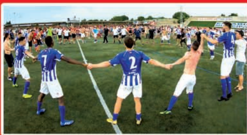
ALAVES B BIGARREN B MAILARA IGO DA