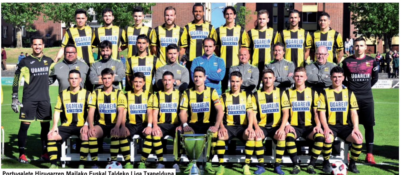
Portugalete Hirugarren Mailako Euskal Taldeko Liga Txapelduna

karia San Ignacio izan zen, zeina, gudu hauetan egin zuen debutean, ezin izan zen lehenengo itzulitik pasa. Arabarrek, hain zuzen, River borroeroaren kontra galdu zuten, Ibaian golik gabe berdindu eta gero Miramarren 2-0 nagusitu zen talde asturiarra.