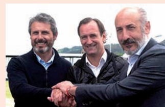
JOSEBA ETXEBERRIA BUELTAN DA ESKUMENDEKOA ZUZENTZEKO