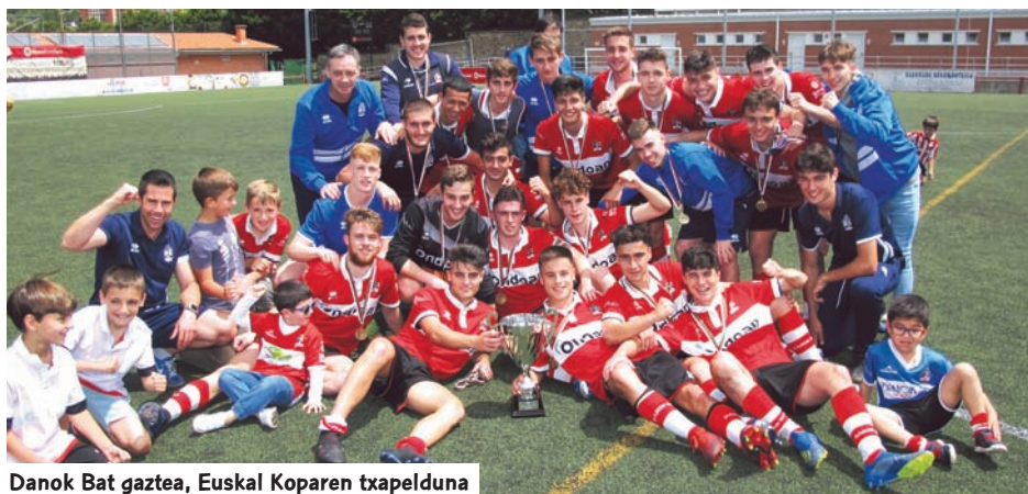
Danok Bat gaztea, Euskal Koparen txapel-duna

Kadeteen kategorian, garaipena Getxorena izan zen, finala etxean jokatu zuen Alavesen kontra, zeina, gainera, markagailuan aurreratu zuen. Bizkaitarrek azkeneko momentuan berdindu egin zuten eta arauzkodenbora amaitu zen 1-1 eta gero, hamaika metrotatik egindako jaurtiketak hasi ziren txapel-dunaren izena argitzeko. Getxo trebeagoa izan zen jaurtiketetan, garaipena lortu zuen txapel-dun amaituz.