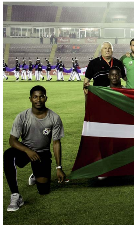
Euskal selekzioko jokariak, Panaman