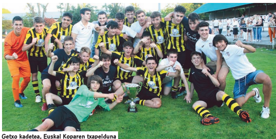
Getxo kadetea, Euskal Koparen txapel-duna