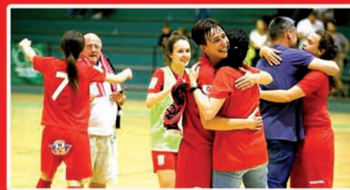
ARETO FUTBOLEKO BILBO EMAKUMEEN 1ª IGO DA