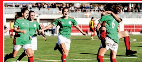
ESTATUKO EMAKUMEZKOEN TXAPELKETA IZAN DA LEZAMAN