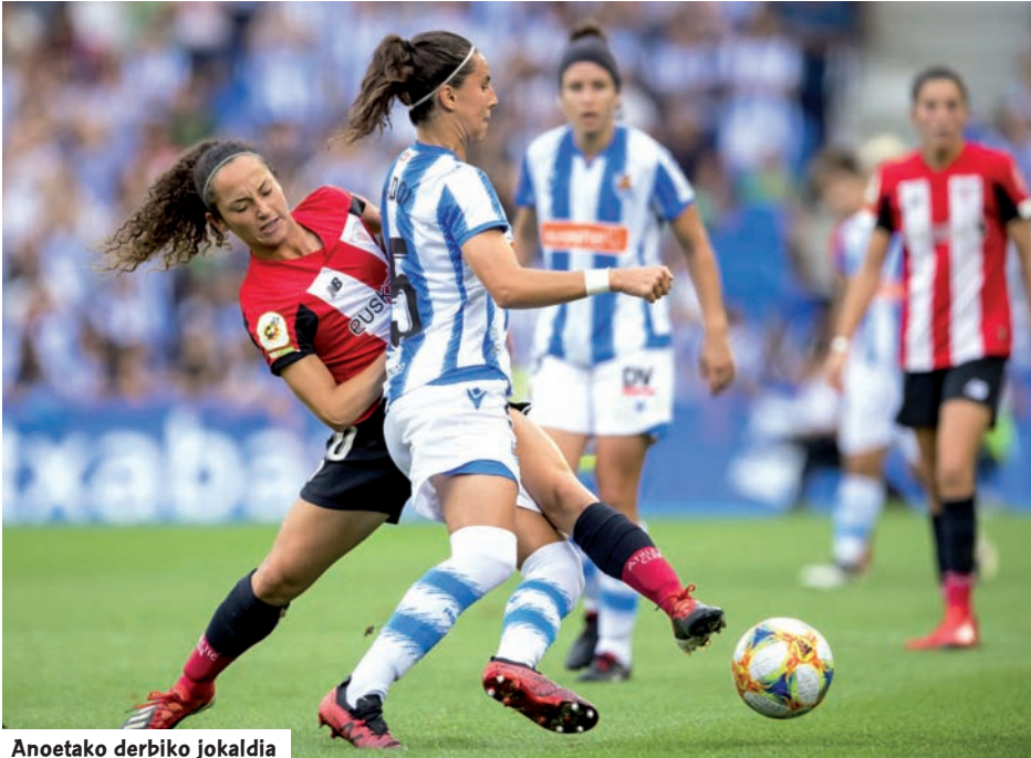
Anoetako derbiko jokaldia