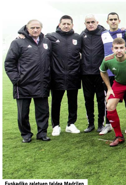
Euskadiko zaletuen taldea Madrilen