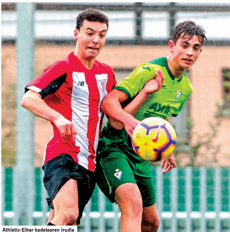
Athletic-Eibar kadetearen irudia

Euskal Kadete Ligan Athletic Clubek Antiguokorekin lehia handia izan du Ligako lehenengo itzulian. Bi taldeek Eibarren lan bikaina estali egin dute pixka bat, nahiz eta Eibar hainbat astez hirugarren postuan egon bi euskal talde handiren aurretik: Real Sociedad eta Alavés. Danok Bat taulako bost lehenengo taldean sartzen saiatzen ari da. Euskal Liga Jubenilean bezala, Kadeteek ere aurten 34 jardunaldi izango dituzte.