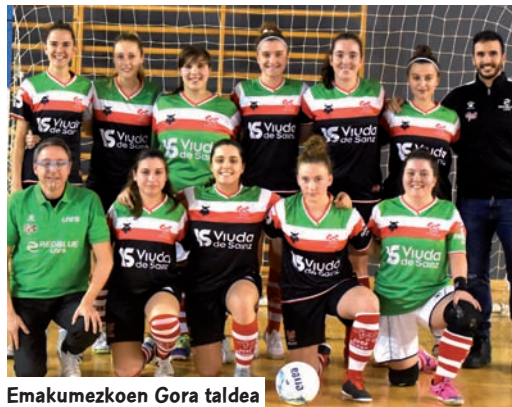
Emakumezkoen Gora taldea

Kategoria horretan, gainera, Zierbenak lortu duen lehen postu bikaina nabarmendu behar da. Otxartabe, Gora eta Elorrietako hasiberriak ere lan polita egin zuten.