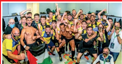
PORTUGALETE 2.B MAILARA IGO DA PLAYOFF EXPRESS-EAN