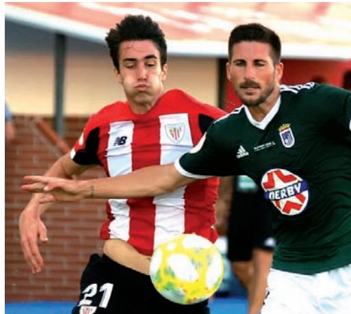
Bilbao Athletic-Badajoz partiduko irudia, play offean

Azken zortzi urteotan, Bilbao Athleticek mailaz igotzeko laugarren play offa jokatu zuen, eta Bigarren B Mailako II. Multzoko euskal talderik onena izan zen, Espainiako Federazioak bukatutzat eman baitzuen 2019/20 Ligako fase erregularra, pandemiaren ondorioz soilik 28 jardunaldi jokatu ondoren. Federazioaren erabaki horrek gosea berdindu gabe utzi zituen Sanse eta Amorebieta taldeak, ordurako donostiarrek eta