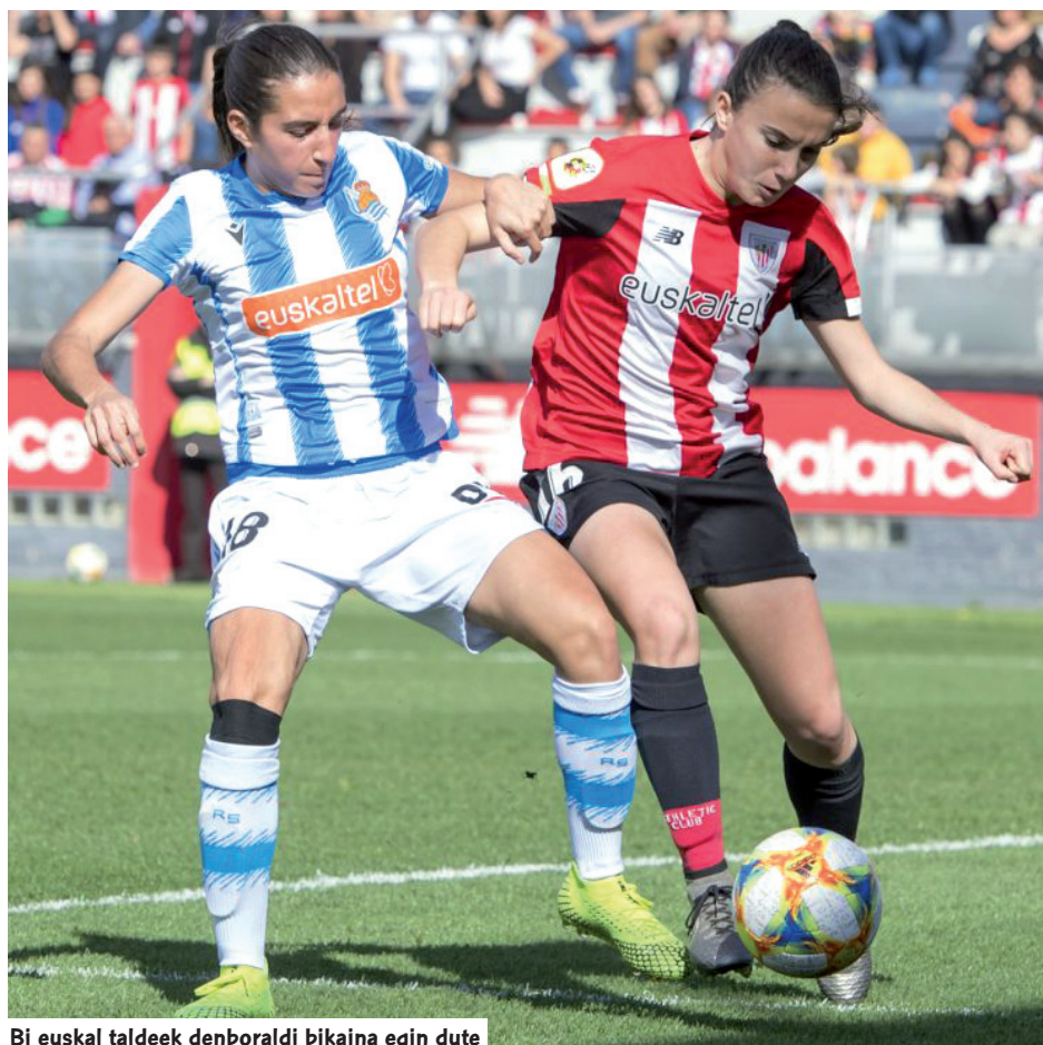
Bi euskal taldeek denboraldi bikaina egin dute