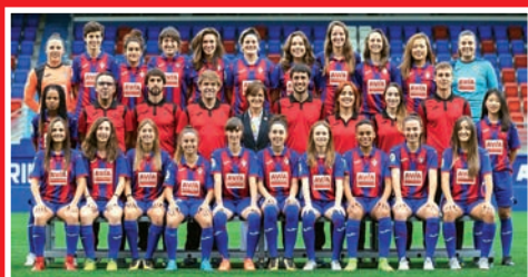
SD EIBAR EMAKUMEZKOEN 1.MAILARA IGO DA

ERREALAK ETA ATHLETICEK KOPAKO TITULUA LORTZEKO LEHIAN ARITUKO DIRA