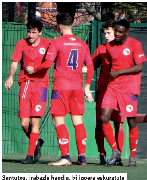
Santutxu, irabazle handia, bi igoera eskuratuta

D enboraldi irregular honetan, Santutxu izan da gazteen kategorian saririk handiena jaso duen kluba. Bilboko klubak gazteen kategoriako bere lehen bi taldeak igotzea lortu du. Bata Ohorezko Mailara eta bestea Nazionalera. Bestalde, Gasteizko Aurrerak ere saria jaso du, gazteen elitean jokatu baitu; eta Euskal Ligako lehen sailkatua izan den Alaves B eta hirugarren postuan geratu den Basauriko Indartsu taldeak, biak ala biak kategoriaz nazionalera lehia-