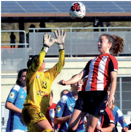
Liga Erregularra lehen postuan amaitu zuen Athletic B-k

B igarren Maila, Iberdrolaren Erronka izenaz ere ezaguna dena, euskal kolorez bete da ezbairik gabe, eta Bartzelonaren filiala izan da