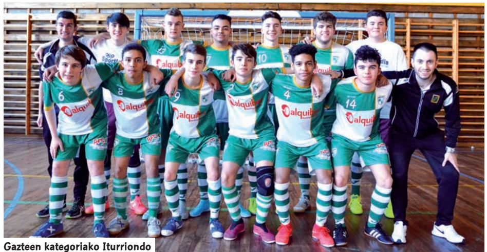
Gazteen kategoriako Iturriondo

A reto-futboleko Euskal Batzordeak, hilerero egiten diren jarduerak eta berrien inguruko informazioa zabaltzeko boletín digital bat sortu du.