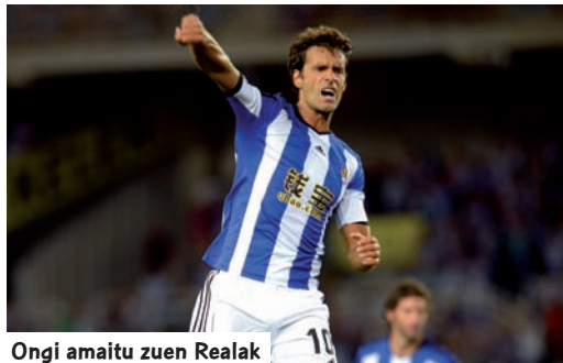
Ongi amaitu zuen Realak

12. postuan amaitu du Realak, onena eta txarrena lortzeko gai izan den denboraldi bitxi batean. Izan ere, Ligako hiru boteretsuak garaitu ditu