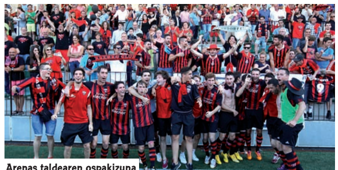
Arenas taldearen ospakizuna