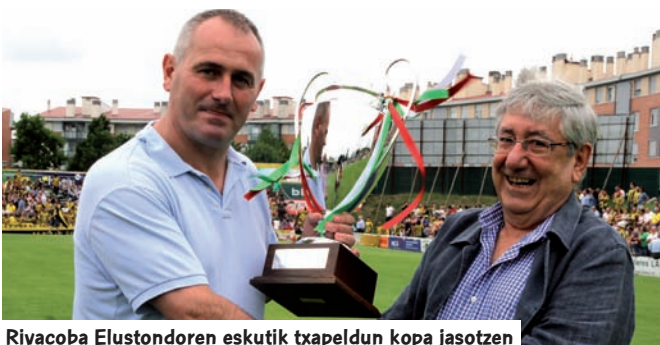
Rivacoba Elustondoren eskutik txapeldun kopa jasotzen

Azkenean, hiruek lortu zuten kategoriaz igotzeko saria euskal futbolarentzat historikoa izan den denboraldi amaieran.