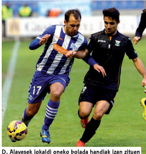
D. Alavesek jokaldi oneko bolada handiak izan zituen

Talde zuri-urdinak 2014/15 denboraldi ona itxi du. Helburua estutasunik ez bizitzea zen eta horrela amaitu du, hamahirugarren lekuan,