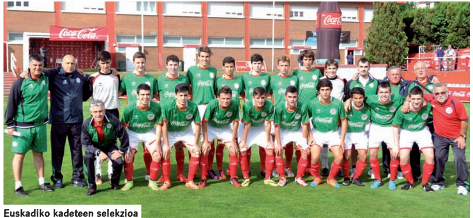
Euskadiko kadeteen selekzioa

K adeteen Euskadiko Selekzioa eta Athletic Coca Cola Kopako Azken Fasean izan ziren. Hiru kolorekoak ez zuen lortu selekzioen