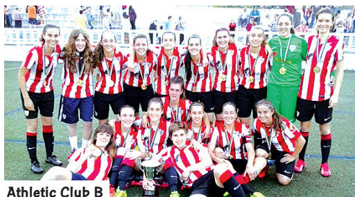
Athletic Club B