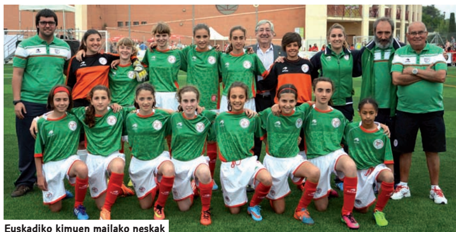
Euskadiko kimuen mailako neskak