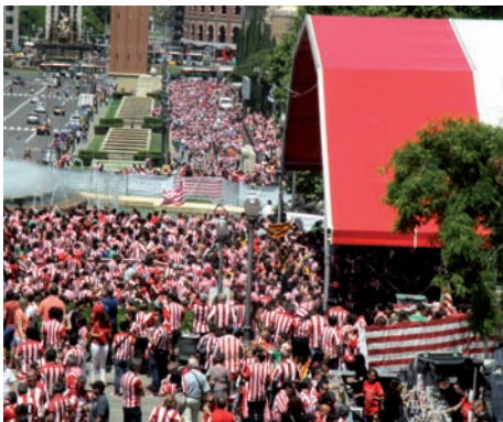
Zale zuri-gorriek etengabe animatu zuten, baina Messiren kalitateak erabaki zuen partidua