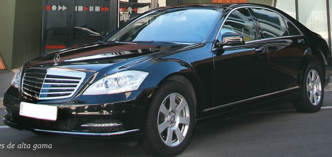
Automóviles de alta gama