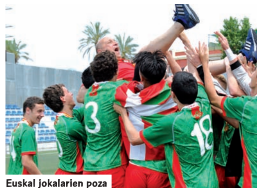
Euskal jokalarien poza