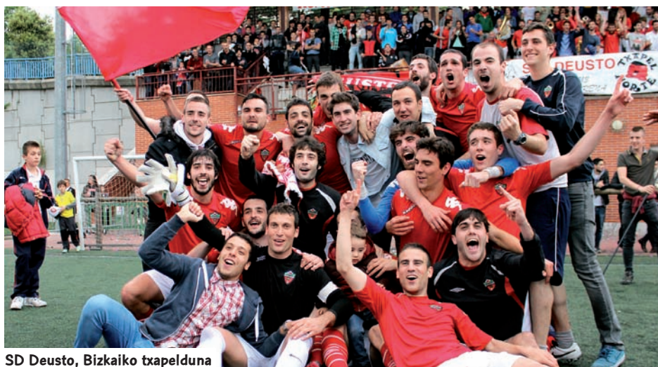
SD Deusto, Bizkaiko txapelduna