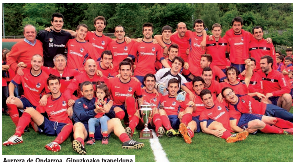
Aurrera de Ondarroa, Gipuzkoako txapelduna