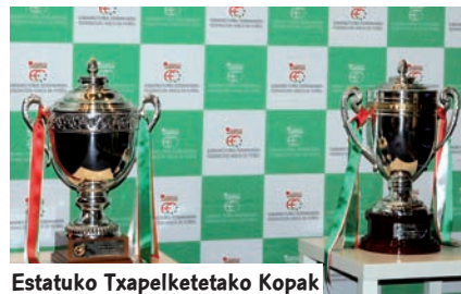
Estatuko Txapelketetako Kopak