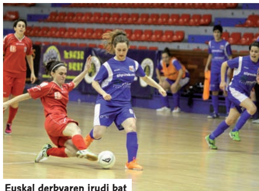
Euskal derbyaren irudi bat

E zinezkoa izan zen. Aurreko denboraldian Lehen Mailara igo ziren bi euskal taldeetako -Bilbo eta Ordizia- batek ere ez zuen lortu kategoriari eustea estatuko areto-futboleko elitean hasitako lehen urtean. Beti azken postuetan egon arren, bi euskal taldeek amore