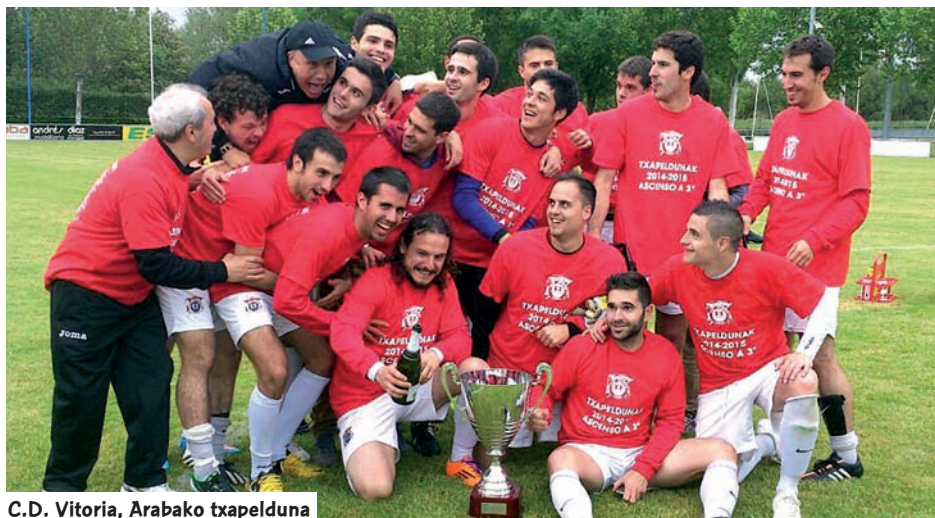
C.D. Vitoria, Arabako txapelduna

Arabarrak Elgorriaga eta Iru-Bat taldeen aurkako lehia politaren protagonistak izan dira, lau eta zazpi puntuz irabazi baitiete, hurrenez hurren. Arabar hiriburuko taldea Hirugarren Mailara itzuliko da azken aldiz egon zenetik lau urte igaro ondoren. Deustuk, bere aldetik, hiru hamarkada baino gehiago behar izan ditu kategoria nazionalera itzultzeko. Tomateroek bigarren itzuli bikaina egin eta Bizkaia, Getxo eta Somorrostro lehiakideak gainditu zituzten txapelketan. Gipuzkoan, hain zuzen ere, talde bizkaitar batek eraman zuen saria, zirkunstantziengatik, ondoko lurraldean aritu delako aurtien arte. Aurrera de Ondarroa taldea buru izan da irmotasunez, atzetik bakarrik Aretxabaletan izan zuen txapelketa batean.