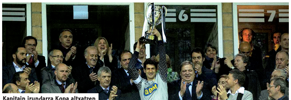
Kapitain irundarra Kopa altxatzen

Real Union taldea, historikoa Estatuko futbolearen, aurten bere mendeurrena ospatu eta Kopako lau titulu irabazi dituena -lehenengoa Racing de Irun bezala-, Federazio Kopako txapeldun