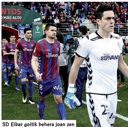
SD Eibar goitik behera joan zen

S D Eibar irribarretsu dago berriro ere, oso Liga amaiera latza bizi ondoren, une askotan eutsiko ziola bizi izan baitzuen. Baina, Deportivo de la Coruñaaren ezusteko erreakzioak, Nou Camp-en 2-0 galtzen joan ondoren, armaginak Bigarren Mailara eraman zituen. Oraindik samina gorputzean, Elxeko taldearen zitekeen jaitziera administratiboaren albistea heldu zen, Ogasunarekin, futbolariekin eta klubeko gainerako langileekin pilatutako zorren-