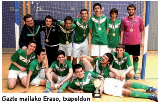
Gazte mailako Eraso, txapeldun

Talde bilbotarraren emakumezkoen filialak Euskal Kopa bereganatu zuen Idiazabal 2-1 menderatu ondoren, bilbotarren aurkako