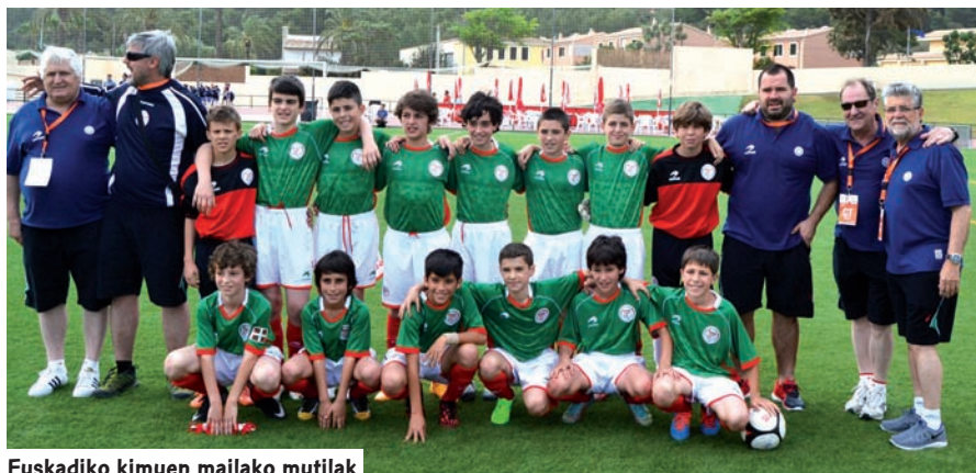
Euskadiko kimuen mailako mutilak