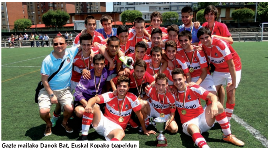
Gazte mailako Danok Bat, Euskal Kopako txapeldun

Kadeteen Kopan, Arabako Olarizu taldeak baino ez zuen lekua hartu finalerdietan, Getxo, Santutxu eta Romo taldeekin batera. Santutxuk Getxo garaitu zuen Finalera heltzeko eta Romo taldeak gauza bera egin zuen Olarizurekin. Maionan jokatu zen ekainaren 6an, txapelketa erabakiko zuen partidua eta, gazteen mailan bezala, zelaiaren faktorea ez zen erabakigarria izan. Romo taldeak Santutxu anfitrioiaren aurka gailendu zen 1-2, bere kanpaina handiari amaiera bikaina emateko.