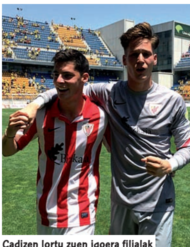
Cadizen lortu zuen igoera filialak