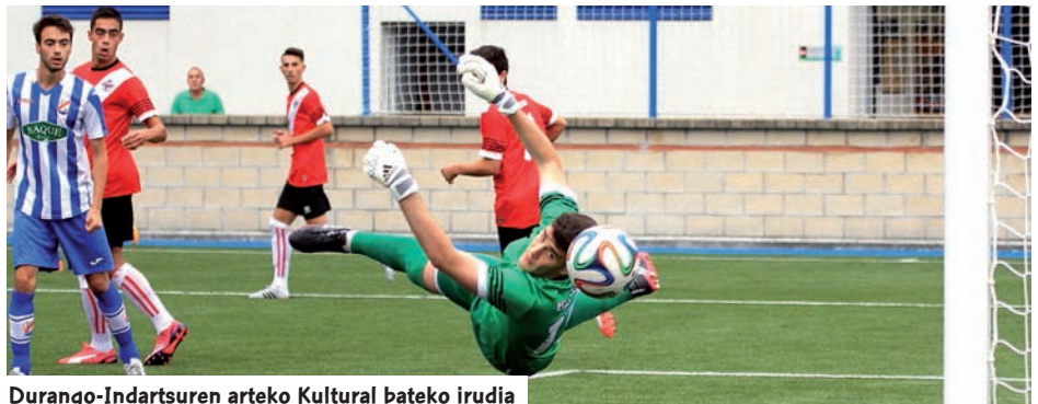
Durango-Indartsuren arteko Kultural bateko irudia

A thletic Kluba lehenengo postuan dago jubenil kategorian onenaren Ligako sailkapenean. Emaitzei dagokionez denboraldi hau Errealarentzat onena ez izan arren, bilbotarrak dira txapelketa menperatzen ari direnak, eta kanpainaren