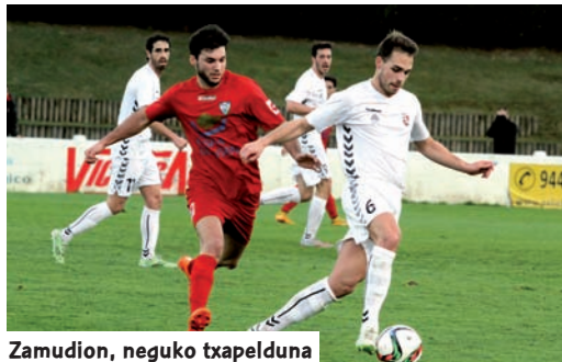
Zamudio, neguko txapel-duna

Zamudio neguko txapel-duna aldarrikatu zen Hirugarren Mailako euskal multzoan, Balmaseda, Lagun Onak eta Vitoria taldeen aurretik. Horiek