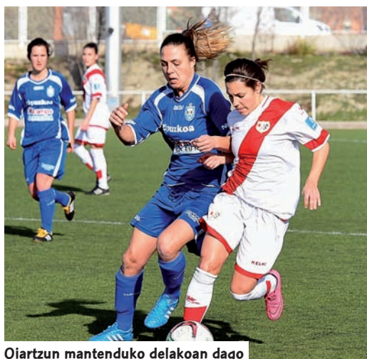
Oiartzun mantenduko delakoan dago