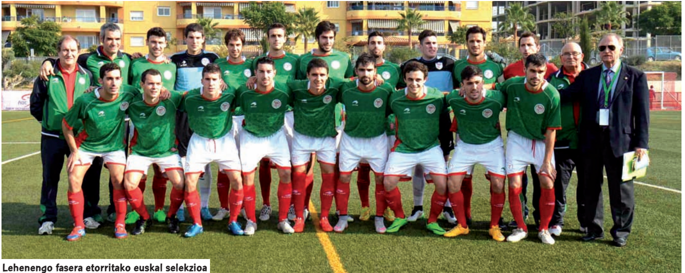
Lehenengo fasera etorritako euskal selekzioa