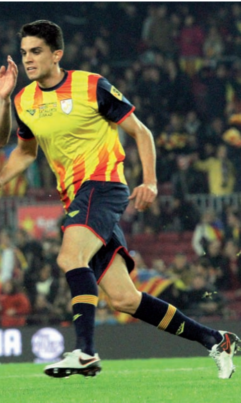
tra, Jordi Alba; Sergio Busquets, Víctor Rodríguez, segunda parte jugaron Masip, Gerard López, Javi Gerard Moreno.