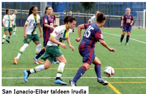
San Ignacio-Eibar taldeen irudia

Zortzi dira Bigarren Mailako gure ordezkariak. Zilarrezko Txapelketak gure helburuak bitan banatzen ditu: Titulua eta kategorian mantentzeko aukera.