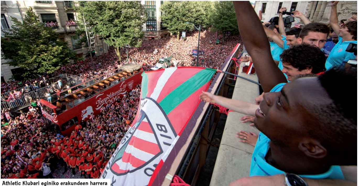
Athletic Klubari eginiko erakundeen harrera