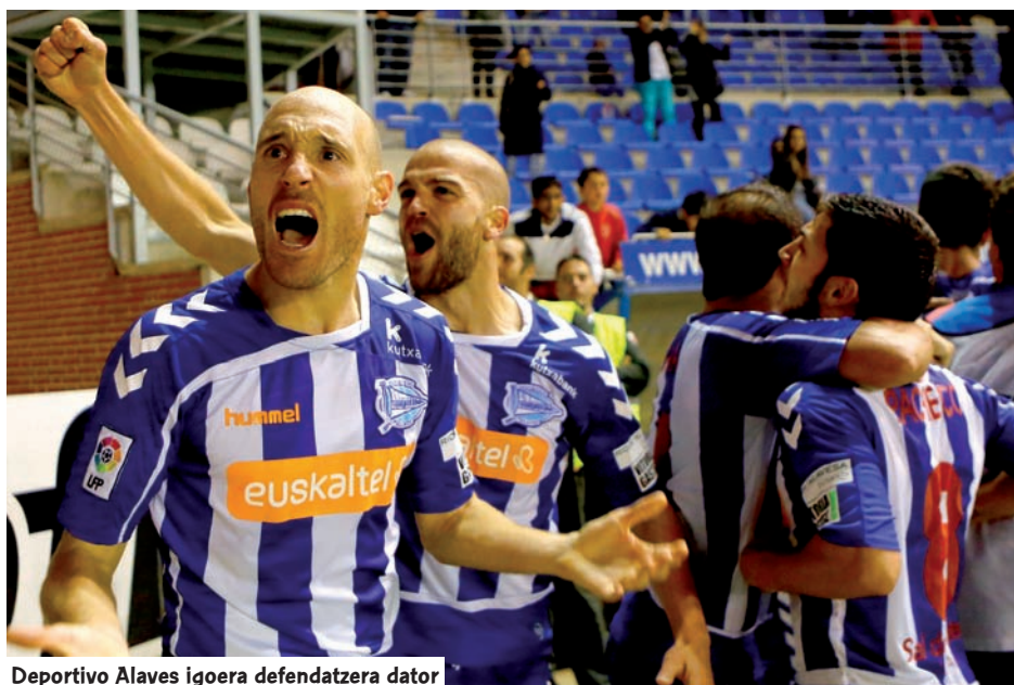
Deportivo Alaves igoera defendatzera dator

ondoren. Azken bederatzi denboralditan, uneko liderrak gero zuzeneko igoera eskuratu zuen, azken txanpan. Hala gertatu zen