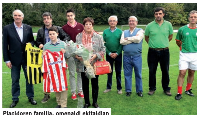
Placidoren familia, omenaldi ekitaldian