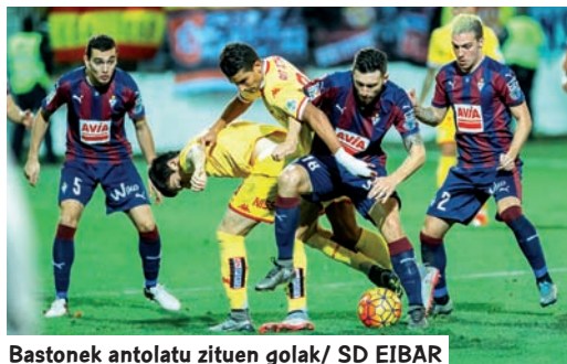
Bastonek antolatutako golak / SD EIBAR

K onplexua aurreikusten zen denboraldi batean, gorputz tekniko berriarekin eta jokalaritza-talde erabat berrituarekin, SD Eibar iraunkortasunaren helburua