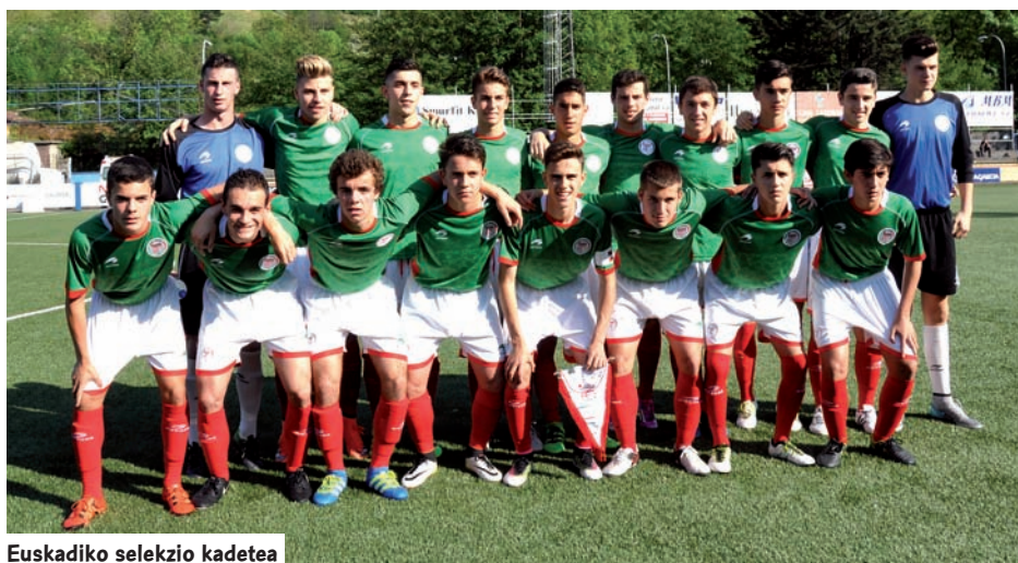
Euskadiko selektzio kadetea