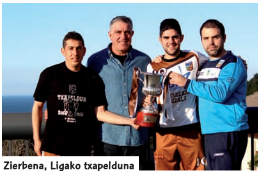
Zierbena, Ligako txapelduna

Z ierbenak Ligako titulua eskuratu du, baita Bigarren Mailara igo-tzea ere, kanporaketan Iberia Toscal taldeari irabazi ondoren.