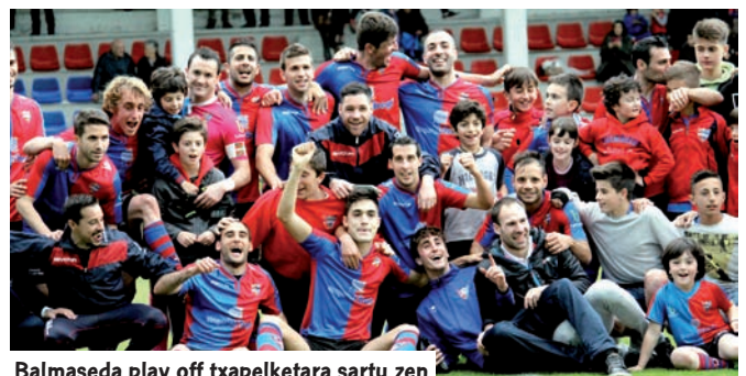
Balmaseda play off txapelketara sartu zen