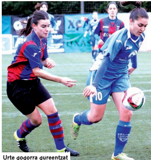
Urte gogorra gurentzat

A thletic B, Añorga, Aurrrera Vitoria, San Ignacio, Mariño, Eibar, Pauldarrak eta Leioako taldeek, hurrenkera honekin sailkatuta,