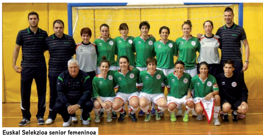
Euskal Selektzioa senior femeninoa