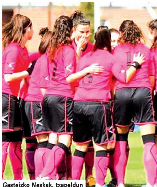
Gasteizko Neskak, txapeldun

E uskal Ligako laugarren edizioak, Gasteizko Neskak taldea utzi zigun txapelketako menderatzaile bezala, titulua eta dagokion Bigarren Mailarako igoera lortzean. Gasteiztarrek urrats bat gehiago eman zuten euren