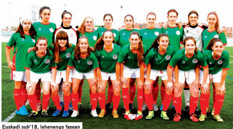
Euskadi sub'18, lehenengo fasean