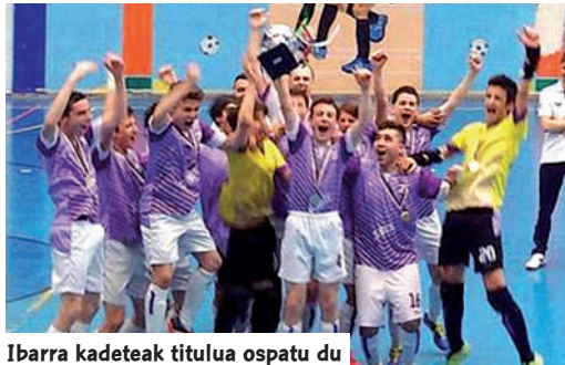
Ibarra kadeteak titulu ospatu du

I diazabal taldea gailendu zitzaien Kluben Euskal Kopan Sasikoa taldeari 3-0 emaitzarekin eta euskal txapeldun femeninoa aldarrikatu zen. Jube-