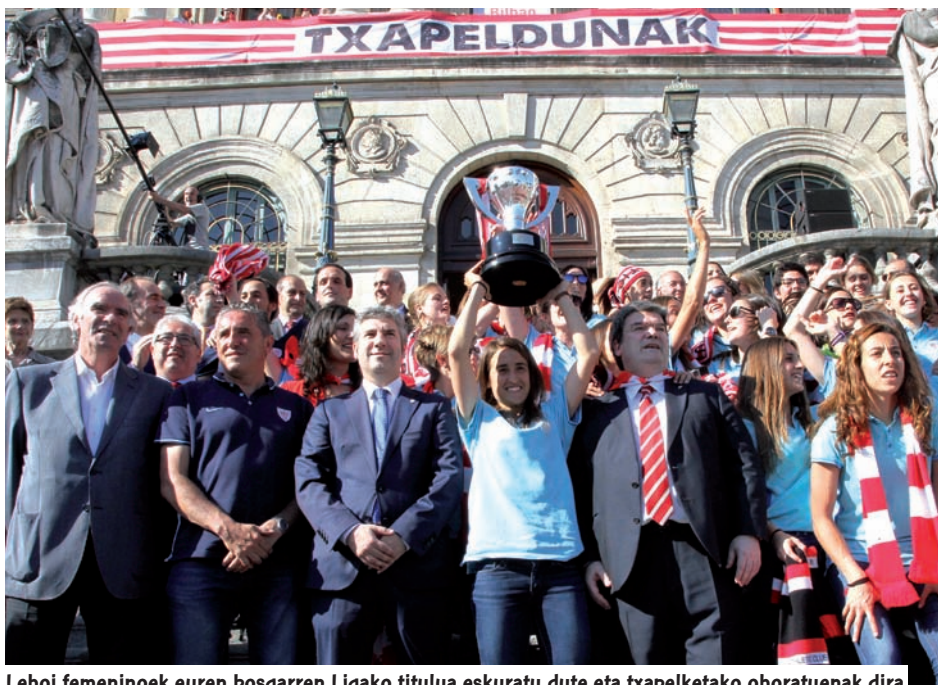
Lehoi femeninoek euren bosgarren Ligako titulua eskuratu dute eta txapelketako ohoratuenak dira