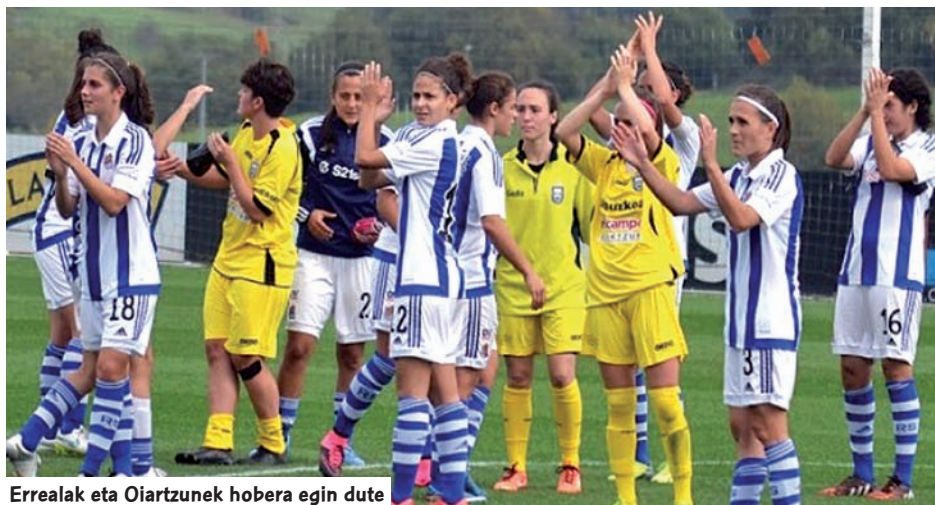
Errealak eta Oiartzunek hobera egin dute