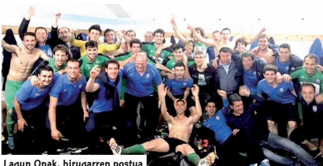
Lagun Onak, hirugarren postua