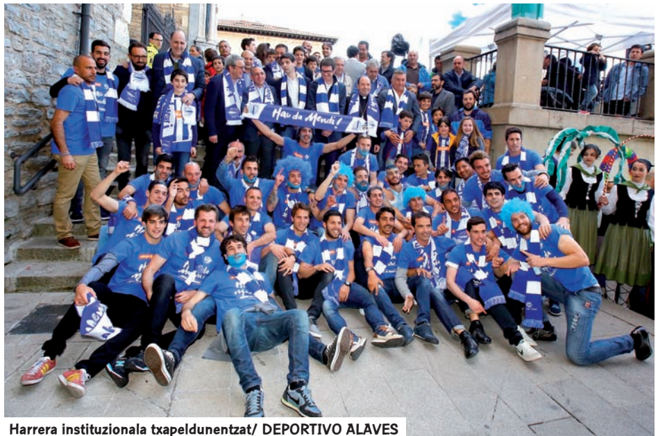
Harrera instituzionala txapeldunentzat/ DEPORTIVO ALAVES

teknikaria aulkian zegoela irabazitako Ligaren ondoren. Jose Bordalasen taldeak, gol gutxien jaso zituena izanik, bere kategoria jauzia ziurtatu egin zuen astebeteko aurrerapenarekin, azken aurreko jardunaldian Numancia taldeari irabaztean eta gogo handiz ospatu zuen Mendizorrozan, ia 20.000 ikusleren aurrean, egun bat geroago, jadanik hiriko agintariekin batera, bere zoriona partekatzeke Gasteiz osoarekin, Andre Maria Zuriaren Plazan.