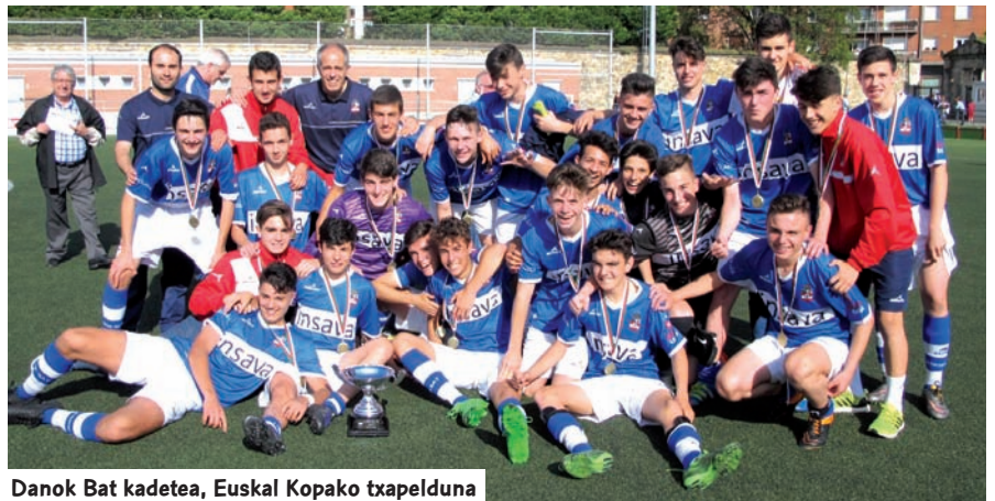
Danok Bat kadetea, Euskal Kopako txapelketa