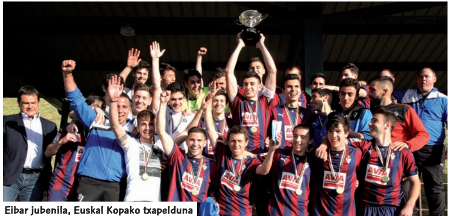
Eibar jubentia, Euskal Kopako txapelketa

Bestalde, gauzak ongi atera zitzaizkion Danok Bat taldeari kadeteen Finalean, Maionan egun berean eta ordu berean ospatuan. Izan ere, Bilboko joko-eremu horretako talde biak izan ziren partidu erabakigarria eskuratu zutenak. Santutxu-Danok Bat derbi lokal erabakigarria, titulu bat jokatzen zuena. Olarizu eta Romo atzean geratu ziren finalerdietan. Partidua-ren emaitza 0-3 izan zen, Danok Bat taldearen alde, gorritzkoen hasiera bikainari aurre egin eta hil ala biziko erasoan jardun ondoren.