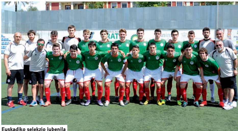
Euskadiko selektzio jubenila

Partidua, Tabiran lehiatua, gure aurkariak lehenengo minutuan aurrea hartzeko eginiko ahaleginarekin abiatu zen. Euskadi berdinketara iritsi zen bigarren denboran, baloi geratuarekin eginiko jokaldi baten eskutik eta araudiaren araberako denbora 1-1 emaitzarekin amaitu zen. Penaltien txandak epaia eman zuen eta amaiera ezin krudelagoa izan zen anfitrioientzat. Valentziak lehenengo biak huts egin zituen, baina hala ere 3-3 emaitza lortu zuen eta bat-bateko heriotzan, Euskadik sailkatzea lortzeko bi jaurtiketa alferrik galdu zituen. Valentzia nagusitu zen, ondoren finalean Madrilekin galtzaile suertatuz.