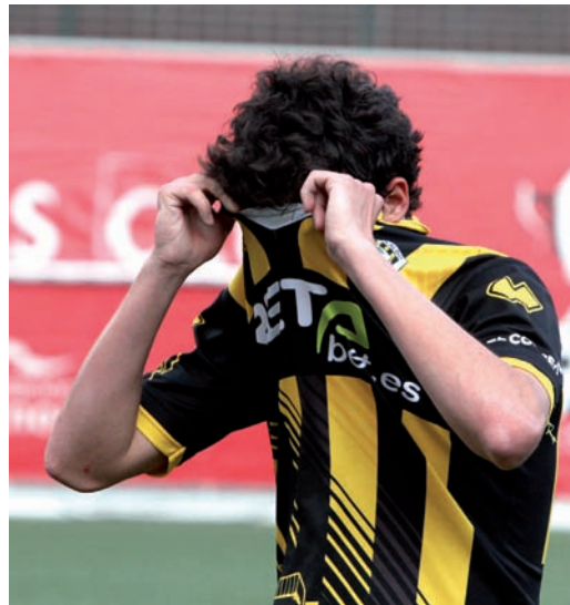
Barakaldori Ligak ihes egin zion azkeneko jardunaldian

K utsu gazi-goza utzi digu kanpaina honek zeinetan taldearen ia erdia Euskadiko jokalariek eratu zuten. Barakaldo, Real Unión, Arenas eta Sestao taldeek txartela eskuratu zuten hurrengo kopa ediziorako, lehenengo bientzat saria txikiegia izan arren. Amorebieta, Real Sociedad B eta Gernika ez ziren gehiegi larritu iraunkortasuna lortzeko orduan, aldiz Leioa sus-