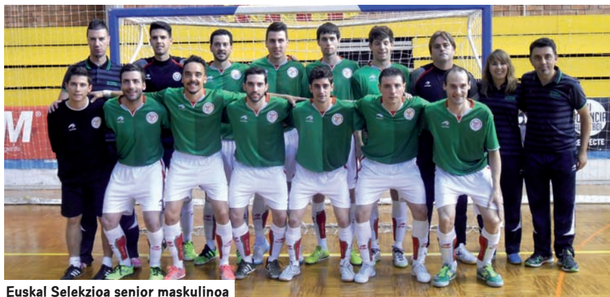
Euskal Selektzioa senior maskulinoa