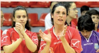
BILBO LEHEN MAILARA IGOZTEKO ZORIAN

B Bigarren Mailako denboraldiko alderdi negatiboa Labastidaren jaitiera izan da, Ligako zoritxarreko azken jardunaldiaren ondoren, izan ere, 6 talde euren artean bereiztea eragin du 2 puntutatik soilik.