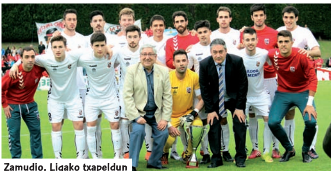
Zamudio, Ligako txapeldun

Bi talde bizkaitar eta gipuzkoar bat izan zituen lagun Zamudio txapeldunak, B 2. Mailarako igoera fasean. Beasain eta Vitoria, bestalde, atetan geratu ziren. Bermeok, bigarren sailkatuak, parekatuta amaitu zuen El Ejido 2012 taldearekin. Toño Vadilloren jokalariek 3-0 emaitzarekin galdu zuten lurralde almeriarrean, horrela, itzulera partidua irabazi izan arren (3-2) kanporatuak izan ziren lehenengo txandan. Zorte berdinekoa izan zen Balmaseda, laugarren postuarekin, izan ere, La Balugan gol batekin berdinketa lortu ostean, 2-1 emaitzarekin galdu egin zuen Murtzian Aguilas taldearen kontra; talde honek halaber irabazi egin zion Lagun Onak taldeari (1-0 Garmendipen eta 2-0 itzulera) Azpeitikoek Aviles taldeari irabaztea lortu ondoren, lehenengo txandako penaltietan.