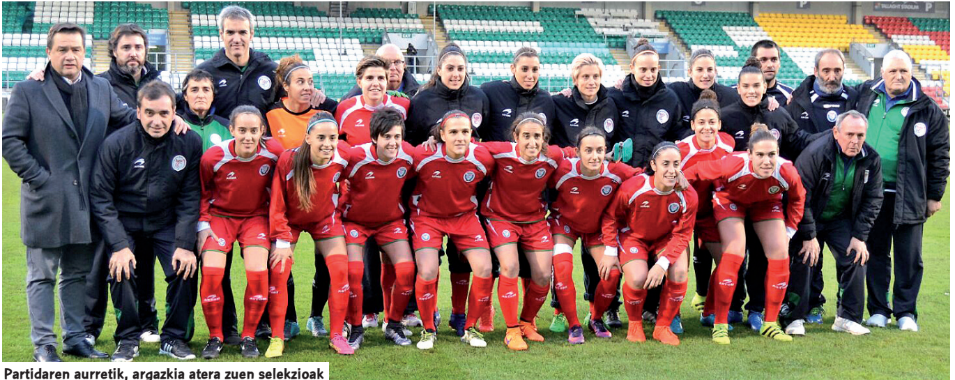
Partidaren aurretik, argazkia atera zuen selekzioak