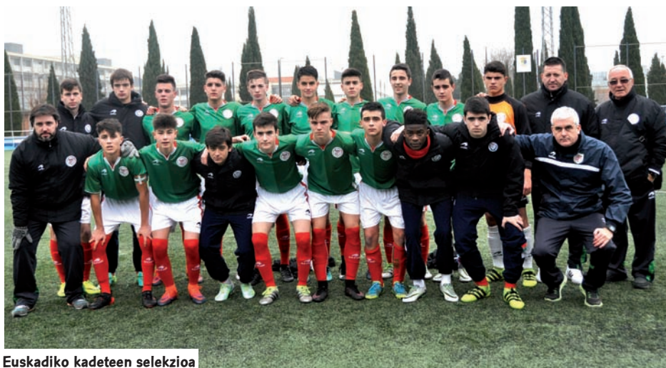
Euskadiko kadeteen selekzioa