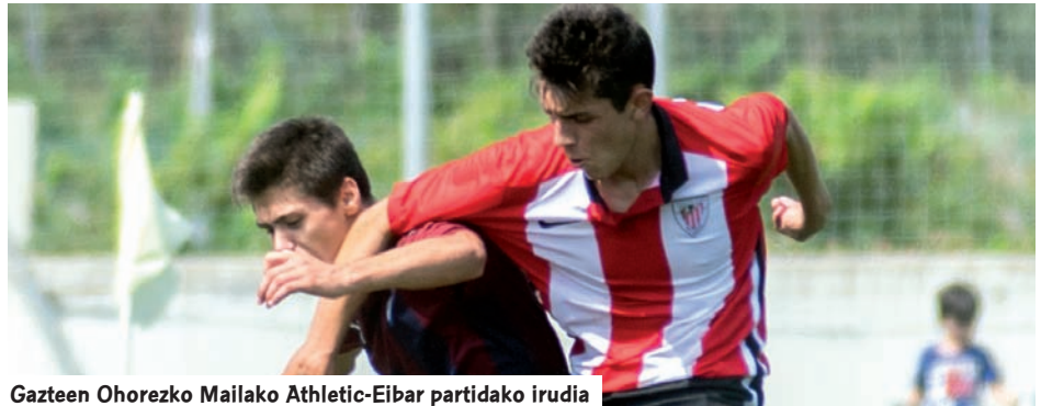
Gazteen Ohorezko Mailako Athletic-Eibar partidako irudia

G azteen Ohorezko Mailan, liderra, Osasuna, harrapatu nahian hainbat talde dago. Euskadiko hiriburuetako talde nagusiez gain (Athletic Club, Real Sociedad eta Alavés), aurten ere beste talde batzuk nabarmendu beharra dago.