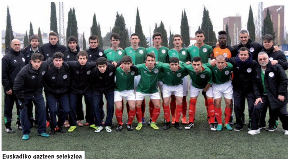
Euskadiko gazteen selekzioa

E uskadikoek Errioxa eta Kantabria izango dituzte aurrean otsailaren 24tik 26ra bitartean jokatu duten bigarren fasean.