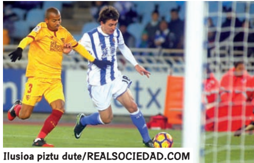
Ilusioa piztu dute

Ilusioa piztu duen lehen bira egin du Realak. Oso emaitza onak lortu ditu eta joko ikusgarria eskaini du; horri guztiari