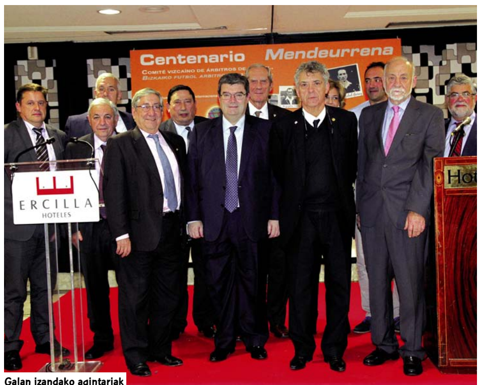
Galan izandako agintariak