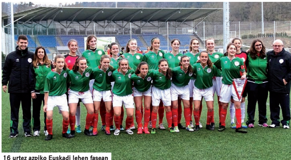
16 urtez azpiko Euskadi lehen fasean