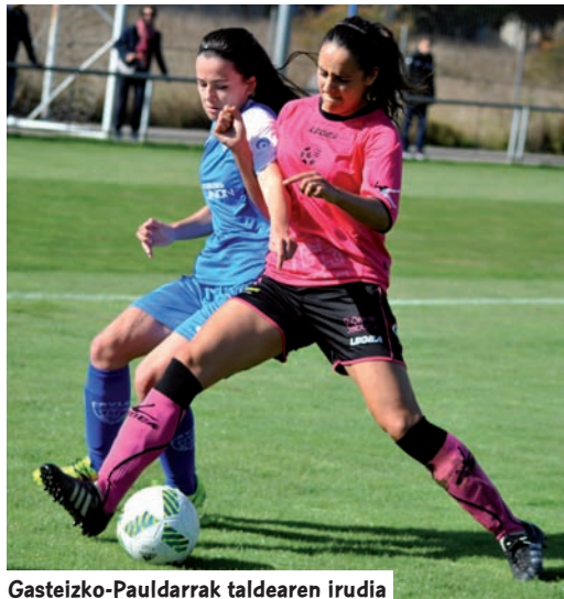
Gasteizko-Pauldarrak taldearen irudia

D enboraldiz denboraldi, areagotu egiten da Bigarren Mailako eskakizuna eta gure taldeek lehiatzeko lan egiten dute. Athleticen filiala titulua eskura-