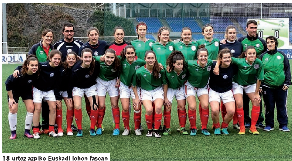
18 urtez azpiko Euskadi lehen fasean