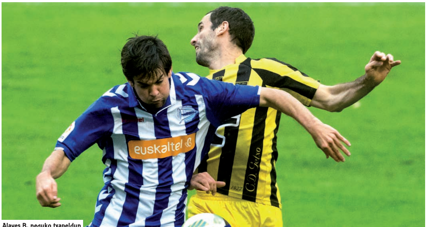
Alaves B, neguko txapeldun

B igarren B mailatik zenbat talde jaitziko diren eta, beraz, herrestatzeen bidetik kategoría nazionala zenbat taldek galduko duten ez jakiteak dakarren ziurgabetasuna dela eta, euskal taldeko kide gehienek hortzak estutu eta ahalik eta puntu gehien bildu beharko dituzte. Hala, Zallak, adibidez, txapelketaren lehen erdian ez du garaipenik lortu eta Pasaia-rekin batera, mailaz jaisteko postuetan dugu, urrun samar, eta Real Sociedad C ere hor dugu. Aurtengo ikasturtean, hamazazpigarren dagoenetik hasi eta ia zazpigarren dagoen taldera arte denak zuzeneko aurkariak dira mailaz ez jaisteko lehian. Taldexka horretatik aipagarria da Tolosak eta Amurriok eginiko lehen itzulia.