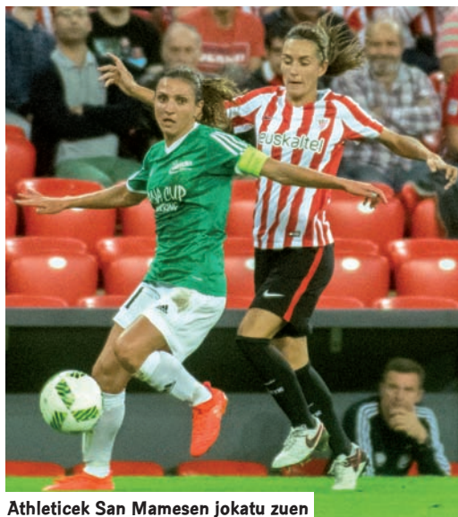
Athleticek San Mamesen jokatu zuen

Bestalde, Real Sociedad taldea lanean ari da Erreginaren Kopa eskuratzeko bere helburura gertu-