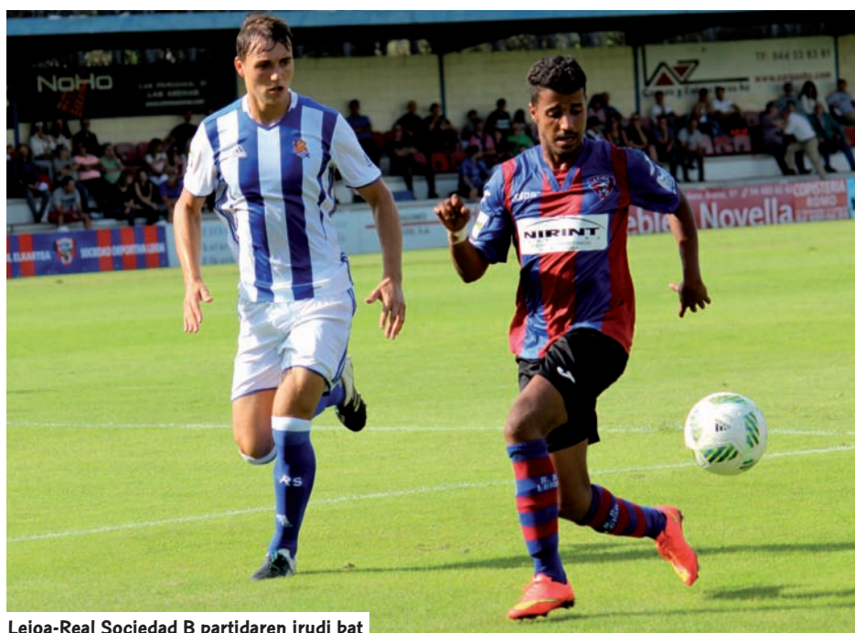
Leioa-Real Sociedad B partidaren irudi bat

Oso aipagarria da, zalantzarik gabe, Gernikak daraman garaipen-bolada (7 garaipen jarraian); izan ere, bi hilabeteko epean, sailkapeneko azkenurreko postuan egotetik, hirugarren egotera igaro da.