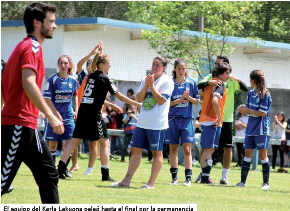
El equipo del Karla Lekuona peleó hasta el final por la permanencia