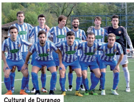
Cultural de Durango