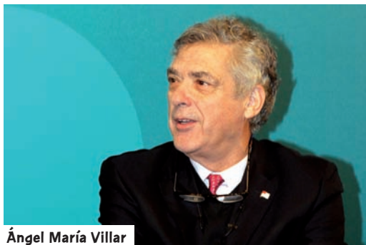
Ángel María Villar

Angel Maria Villar Espainiako Futbol Errege Federazioaren arduraduna izaten mantenduko da hurrengo lau urtetan, hauteskundeak erabakigarritasunez irabazi ondoren.