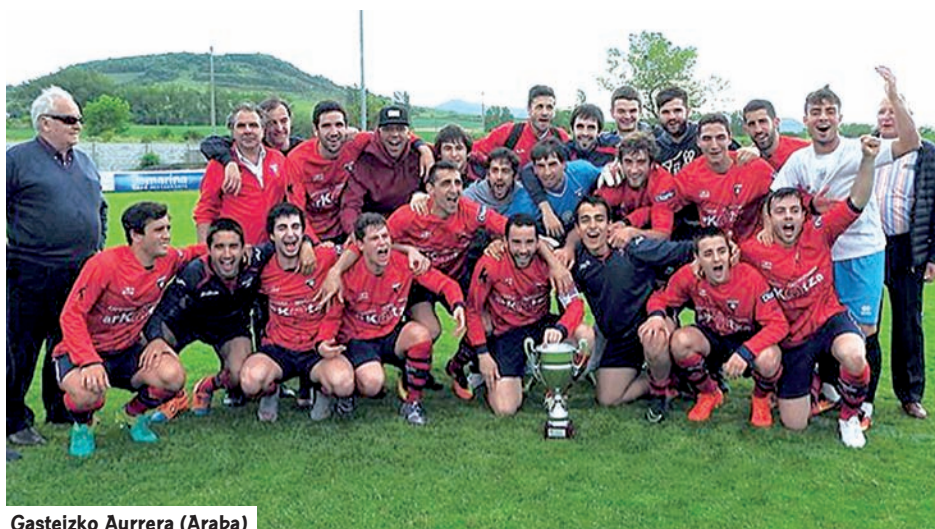
Gasteizko Aurrera (Araba)

Anaitasuna taldeak, bestalde, bere txapelketa bermatu zuen, Liga zirrargarri bateko azkeneko jardunaldian, Hernani taldearekin buruz buruko partidu hunkigarri bat lehiatu ondoren. Azkoitiakoek Zubipe taldearekiko puntu bat gehiago-rekin amaitu zuten.