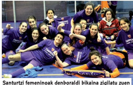
Santurtzi femeninoak denboraldi bikaina zigilatu zuen

Santurtzi femeninoak amestetako denboraldi bat izenpetu zuen Lauburu Ibarren aurka Euskadiko Txapelketa irabaztean. Santurtziarrak