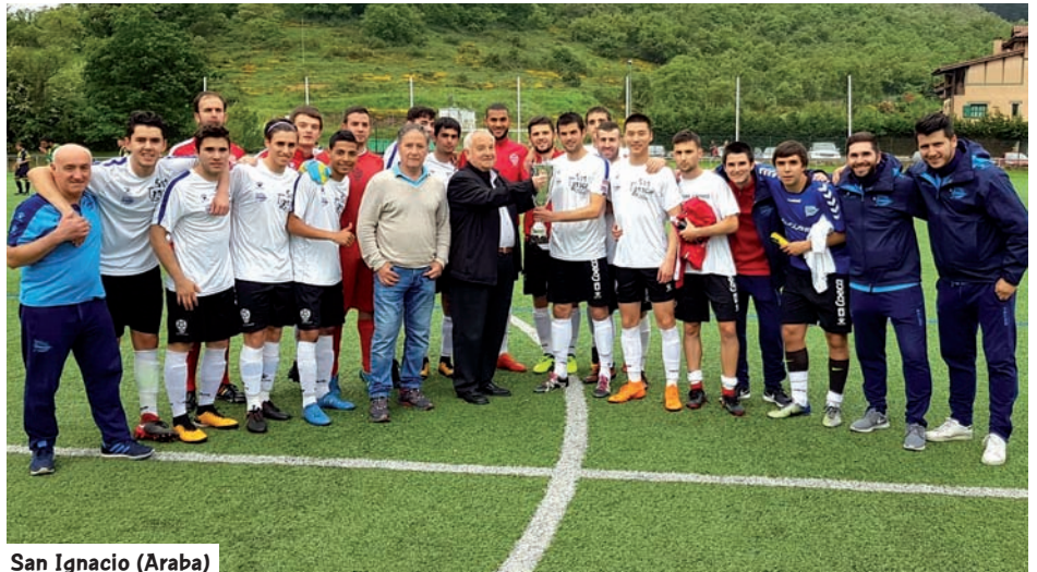
San Ignacio (Araba)

San Ignacio Hirugarren kategoriara itzuli da, justu 2008/09 kanpainan kategoria horretan azaldu zenetik hamar urte igaro direnean. Euskadiko hiriburuko taldeak 14 garaipean uztartu ditu jarraian; soilik porrot bat ezagutu du denboraldi osoan eta aldeko ehun golak gainditu ditu. Bestalde, Ligako amaiera sprint bikain bat nahikoa izan da Sestaoko taldearentzat Iurretako, Gatika eta Erandio taldeen gaintetik ezartzeko, Bizkaian titulua lortzeko borrokan. Gorri-urdinek halaber esperientzia dute Hirugarrenean. Azken aldiz 2007/08 ikasturtean lehiatu ziren. Askoz ere larriagoa gertatu da oraindik Gipuzkoako Ohorezko Mailako txapelketarena; bertan, Ordizia eta Pasaia azken jardunaldira puntuen berdinketarekin iritsi ziren. 'Urdinek' ezin izan zuten Hernaniren aurkako partiduan hiruko berdinketa gainditu etxean; hutsegite hori Pasaia aprobetxatu zuen, Real Unión B taldeari etxean 1-2 irabazi zionean. Horrela itsasaldekoak Hirugarrenera itzuli ziren, kategoria hori galdu zutenetik soilik hamabi hilabete iragan ondoren.