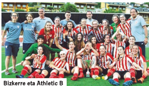
Bizkerre eta Athletic B

ziren Arratia, 8 puntura, eta Tolosa, 11ra. Biek erritmo harrigarria mantentzen saiatu ziren lehen postuetan, baina amore eman zuten. Leioako laugarren postuan geratu zen. Goierri eta Betiko taldeekin leiotarren atzetik tarte bat zabaldu zen. Barakaldoko zazpigarren postutik beharantz, mantentzea lortzeko borroka abiatu zen. Industrialak salbatu egin ziren bigarren txanda bikain batekin, urtea amaituz horrela: 39. Oiartzun B (38), Elorrio (37), Arizmendi (37) eta Hernani (36). Sufritu egin zuten baina arrasteak saihestu zituzten, Mariño (32) taldeak bezala. Gurutzeta Pauldarrak B (31) taldearentzat izan zen, bere lehenengo taldearen jaitzieragatik kondenatua suertatuz. Derio taldeak amore eman zuen 25ekin, Añorga B taldeak baino bi gehiago lortuz, zuzeneko jaitsieraren posizioan. Taula Lakua (12) taldeak osatu zuen. Amaitzeko, Arizmendiren dimisioaren ondoren Derio Euskal Ligan mantenduko dela jakinarazi zen. Euskal Kopa Athletic B taldearentzat izan zen Ellakuriko Finalean Añorgaren aurka 2-4 emaitzarekin nagusitu ondoren.