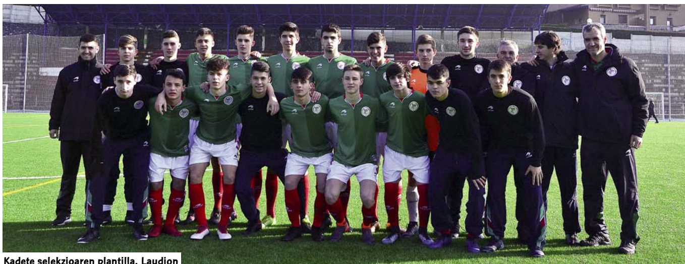
Kadete selekzioaren plantilla, Laudion