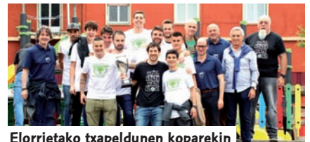
Elorrietako txapelketa koparekin

gainditu zituen, titulua emango zioten 71 puntu lortuz. Aretxabaleta eta Soloarte jaitsi egin ziren. Euskal Ligan, Elorrietako taldearen denboraldi distiratsuari esker 49 punturekin txapelketa aldarrikatzeko eta Hirugarren kategoriara jauzia ematea lortu zen. Nazionalera lagunduko diote bigarren sailkatutako Gora Bilbao taldeak, halaber kanpaina bikaina egin ondoren eta Batzarre hirugarrenak.