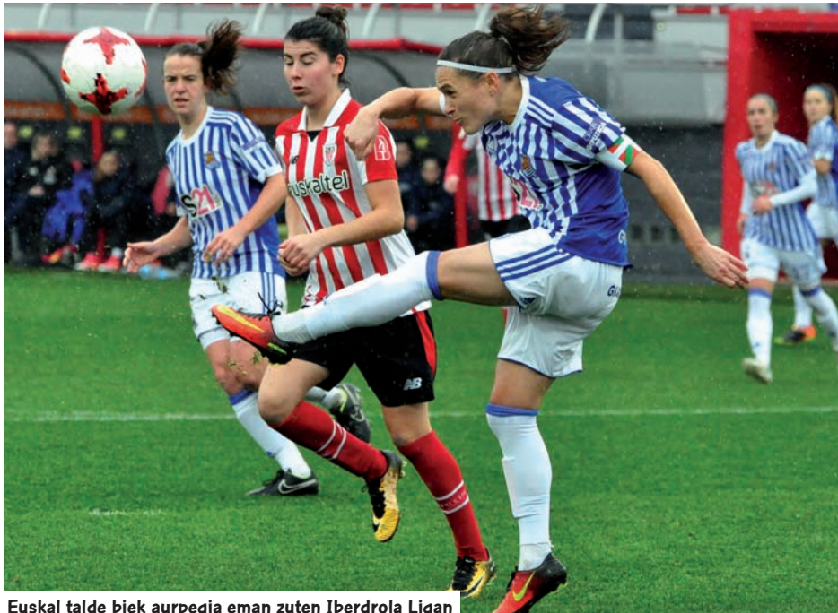
Euskal talde biek aurpegia eman zuten Iberdrola Ligan