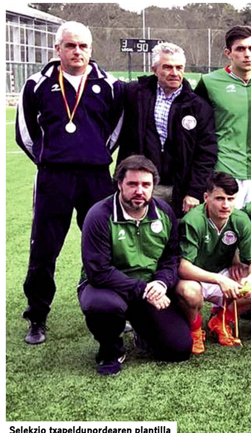
Seleksio txapelketaren plantilla

Apirilean, eta Madrilgo Boadilla del Monte udalerriko egoitzan, partidu erabakigarriak lehiatu ziren. Euskadik finalaurrekoetan berdinketa lortu zuen anfitrioiekin eta Tabuenkaren jokalariek bere konpromisoa ebatzi zuten madrildarren aurkako 3-0 garaipenarekin. Hiru kolorekoak, ondorioz, Final handian sartu ziren. Euskal taldeak titulua berriro eskuratzeko aukera izan zuen, 2015. urtean bezala. Azken partiduan Valencia izango zuen zain, honek Canarias taldeari mini-