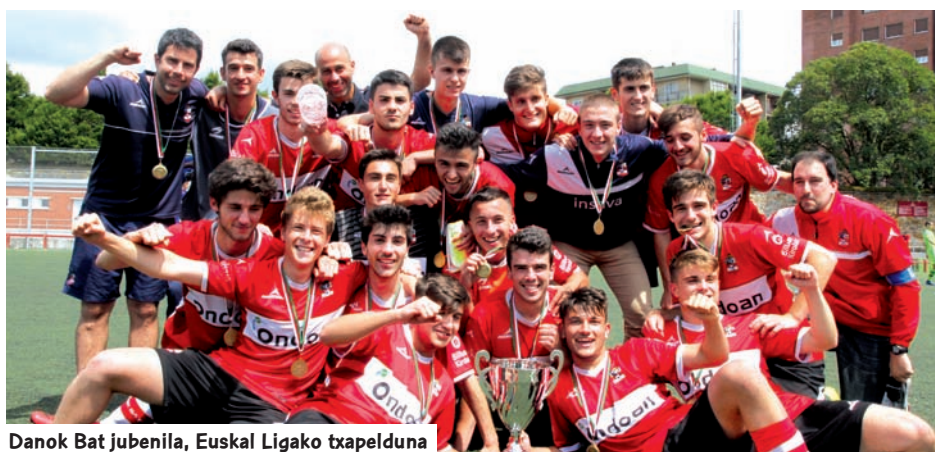
Danok Bat jubenila, Euskal Ligako txapelduna

Kadete kategorian halaber Alavés taldea lehiatu zen. Baina garaipena Romo taldearentzat izan zen, babazorroen zelaian lehiatutako partidu erabakigarrian 3-5 emaitzarekin nagusituz. Talde bizkaitarrak buru-belarri jardun behar izan zuen partidu erabat lehiakor eta aldakor batean. Romo aurreratu egin zen eta Gasteizko taldeak altxatzea lortu zen, bi alditan aurretik finkatuz, baina bizkaitarrak hiru gol gehiagorekin nagusitu ziren.