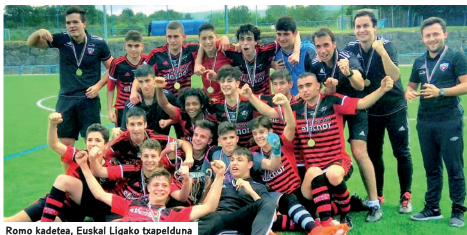
Romo kadetea, Euskal Ligako txapelduna