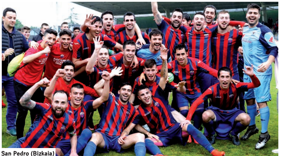
San Pedro (Bizkaia)