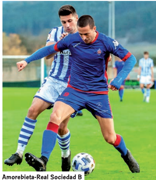
Amorebieta-Real Sociedad B

Bilbao Athleticcek, Amorebietak eta Real Sociedad B, ordena horretan, hiru faseetako lehenengoaren erdialdera iritsi ziren, Ligako txapelketa aurrean hiru faseetan banatuko baita Bigarren Mailara igotzeko eskubidea ematen duten postuetan. Real Union, Alaves B eta Arenas taldeek ere, oraingoz Kantabriak dituen bi ordezkari bakarrak gainditu dituzte Bigarren B Mailako II. multzoko A azpimultzoan, eta Portugaletak,