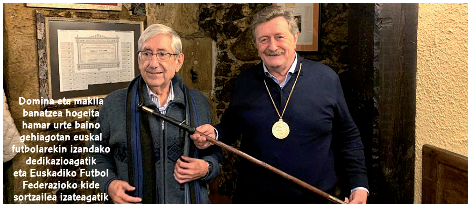
Domina eta makila banatzea hogeita hamar urte baino gehiagotan euskal futbolarekin izandako dedikazioagatik eta Euskadiko Futbol Federazioko kide sortzailea izateagatik

Euskadiko Futbol Federakundearen Presidentea