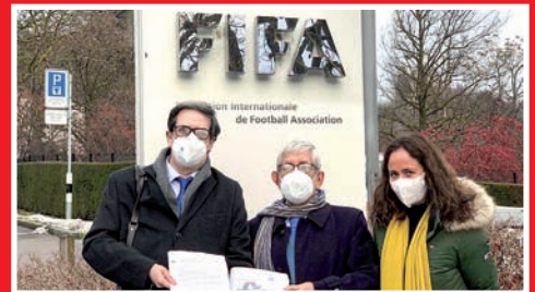
OFIZIALTASUN ESKAERA FIFA ETA UEFAREN AURREAN