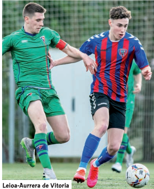
Leioa-Aurrera de Vitoria

O hiz kanpoko kanpaina honetan, Gazteen Ohorezko Mailak bi azpimultzo ditu. Eta lehenengoan, talde guztiak (10) euskaldunak dira: Alaves, Antiguoko, Arenas, Athletic, Aurrera Vitoria, Danok Bat, Eibar, Leioa, Santutxu eta Real. Txapelketaren itzulera oso zorrotza izan da, aste barruan jokatzeko ari baitira pandemiak atzeratutako jardunaldiak berreskuratzeko partidak. Gazteen Liga Nazionalan, berriz, euskal taldeak bi