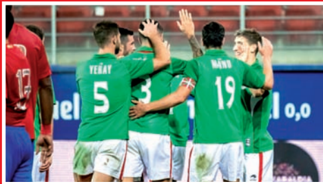
EUSKAL SELEKTZIOA: BATU GAITU