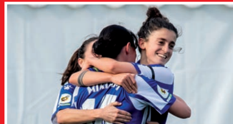
EMAKUMEZKOEN DEPORTIVO ALAVÉS 1. MAILARA IGO DA