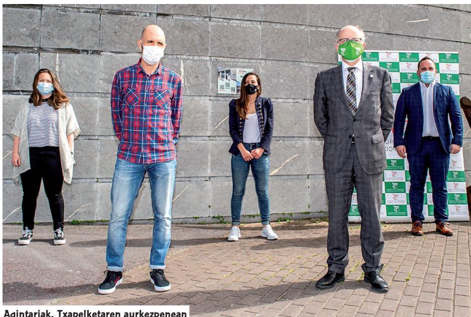
Agintariak, Txapelketaren aurkezpenean

Arazo burokratikoaren ondorioz Nigeriako selekzioa ezin izan zen etorri 'Basque Country International Women's Cup' honetara, lau talderen arteko lehia izateko asmoa zen arren.