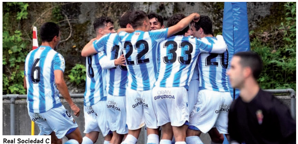
Real Sociedad C