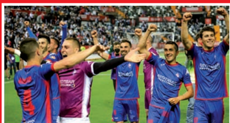
AMOREBIETA BIGARREN MAILARA IGO DA