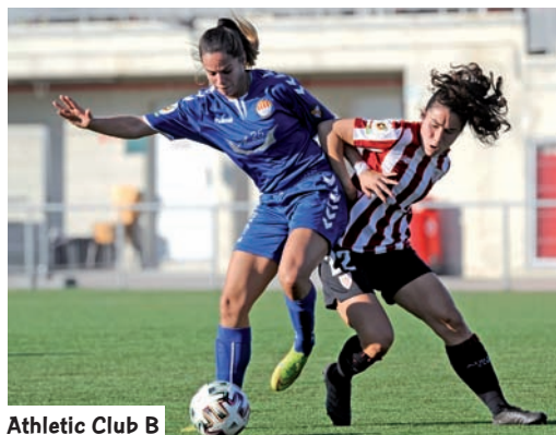
Athletic Club B