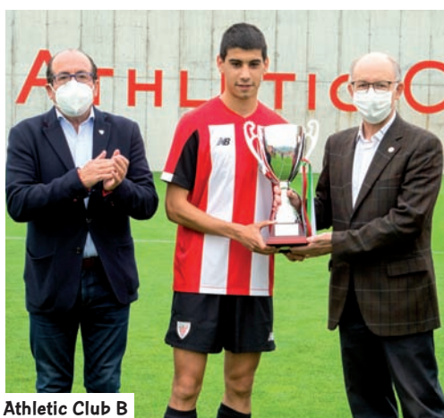
Athletic Club B