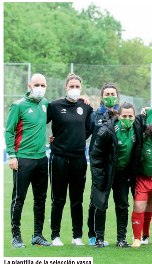
La plantilla de la selección vasca

"No tenía ninguna duda de que íbamos a tener nivel, la gente que está es de Primera y lo hemos demostrado desde el principio. Ante Argentina hemos hecho un gran partido. Quizás en el segundo encuentro, con los desajustes de los cambios, hasta que te metes en el partido por el formato que es... Pero hemos acabado muy bien", va-