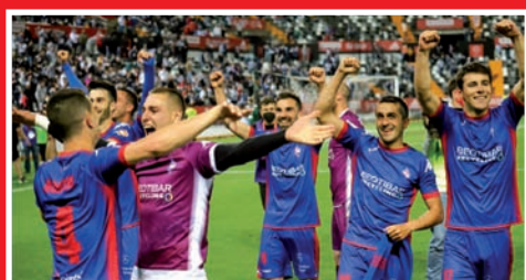
EL AMOREBIETA ASCIENDE A SEGUNDA DIVISIÓN