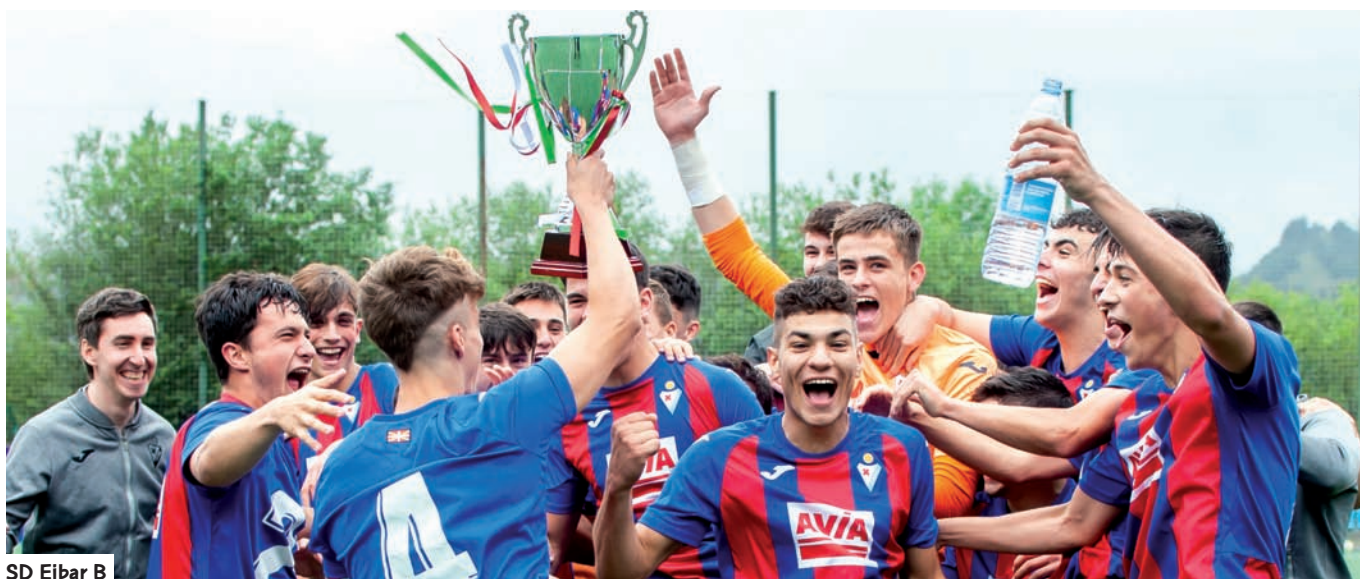
SD Eibar B