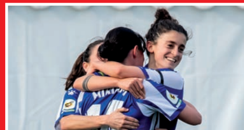
EL DEPORTIVO ALAVÉS FEMENINO SUBE A LA PRIMERA DIVISIÓN