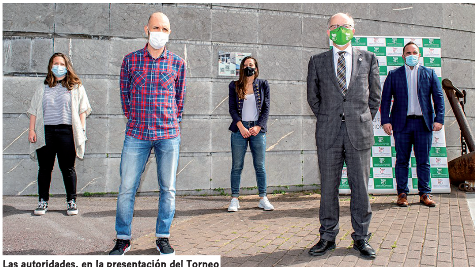
Las autoridades, en la presentación del Torneo

Problemas burocráticos impidieron a última hora que la selección de Nigeria, con quien se contaba también para esta 'Basque Country International Women's Cup', pudiera viajar a tierras vascas para tomar parte en este torneo que estaba pensado en formato final a cuatro.