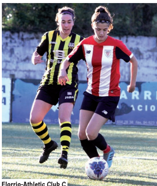
Elorrio-Athletic Club C

El Athletic Club C fue el ganador del bonito pulso con el Eibar B por ser campeón de Liga Vasca. Ambos firmaron siete victorias y un empate, en la fase de ascenso, por lo que el punto de ventaja que consi-