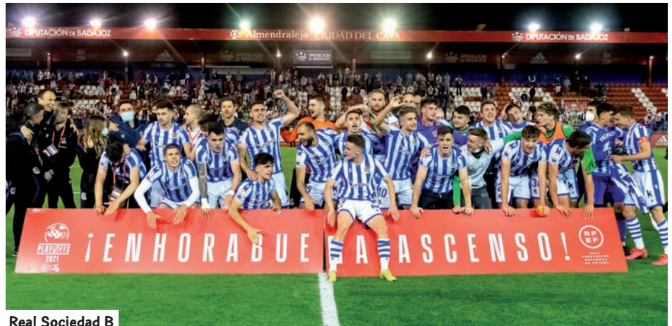
Real Sociedad B

Tras quedar campeón de grupo en la fase regular los pupilos de Xabi Alonso eliminaron al Andorra (2-1) en la primera ronda del play off, a partido único y en sede neutral, mientras que también superaron al Algeciras (2-1), tras prórroga una vez más, en la segunda y definitiva eliminatoria por subir. Por su parte, el Amorebieta, que ya había dado la sorpresa al colarse entre los 16 mejores equipos de 2ªB, se impuso 0-1 al Lina-