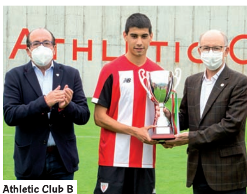
Athletic Club B