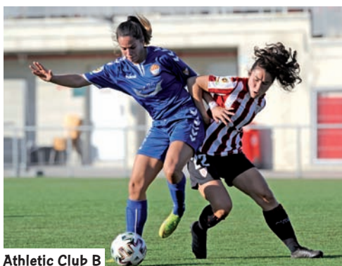
Athletic Club B

Una de las grandes noticias que nos deja esta temporada es el ascenso del Alavés Gloriosas a la máxima categoría del fútbol femenino Nacional. La escuadra dirigida por Mikel Crespo terminó líder del Grupo Norte B y después completó la gesta. Las gasteiztarras supieron aguantar la presión