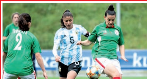
LA EUSKAL SELEKZIOA FEMENINA TRIUNFA EN SU TRIANGULAR