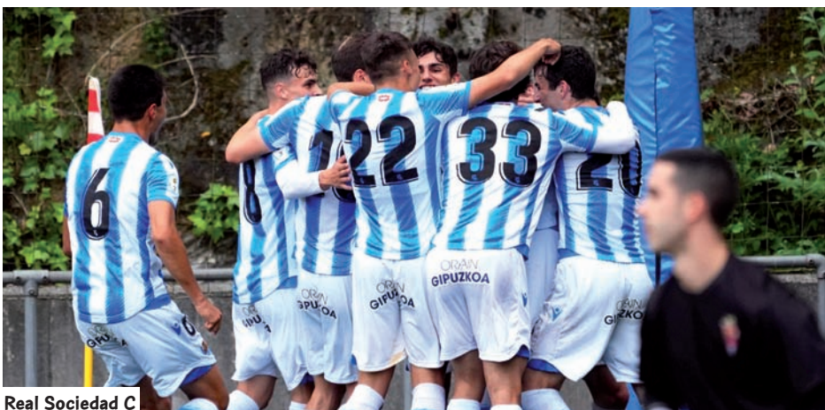
Real Sociedad C