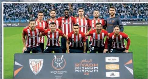
ATHLETIC CLUB, SUPERKOPAKO TXAPELDUNORDEA