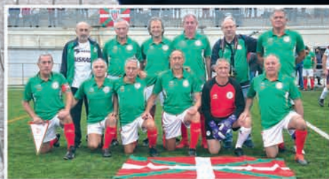
WALKING FOOTBALLEKO EUSKAL SELEKZIOA ABIAN DA