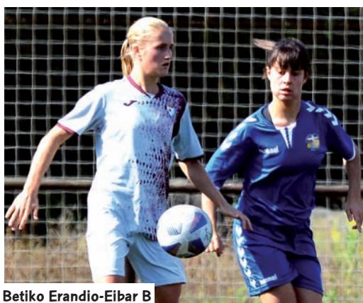
Betiko Erandio-Eibar B

P ronostikoak betetzen ari da Eibar B, eta agintemakila eskuratu du oraingoz Euskal Ligan. Hasi aurretik, aurkariek argi ohartarazi zuten eibartarrak izango zirela beren lehiakide nagusiak, erakutsitako