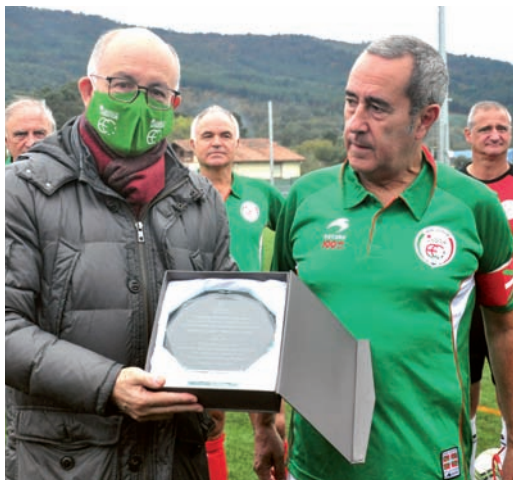
selektzio nazionalen Walking Football Munduko Lehen Txapelketan.

W alking Footballeko Euskal Selektzioak, Euskadiko Futbol Federazioaren laguntzarekin sortu berri denak, urriaren 30ean egin zuen debuta Lezamako instalazioetan Ingalaterraren aurka. Bere ibilbidean selektziorik indartsuena dela uste da, eta oraindik ez da garaitua izan. 50 urtetik gorako eta 60 urtetik gorako kategoriei dagozkien bi partida jokatu ziren. Horrela, Walking Footballeko Euskal Selektzioa 2022ko maiatzerako prestatzen hasi zen, orduan parte hartuko baitu FIWFAk Manchester-ren antolatutako