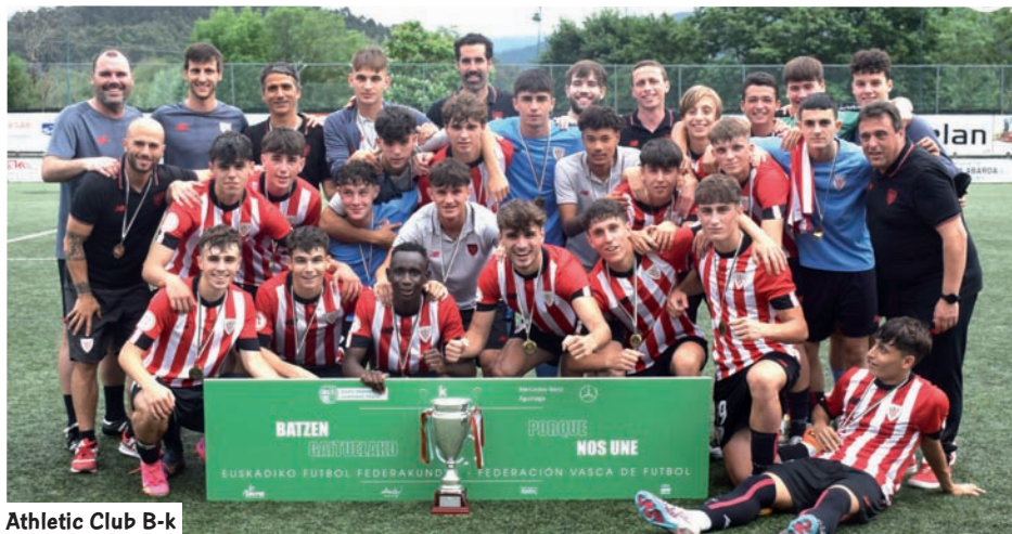
Athletic Club B-k

Azkenik, Laudion aukera izan zuten Ellakuri estadioan egiten zuten bero handiarekin parte hartzaile guztiek egin zuten ahaleginaz gozatzeko. Justu-justuan eta azken uneetan izan zen, baina CD Elorriok Deportivo Alaves kanporatu zuten finalerdietan. Eta, geroxeago, bigarren finalerdian,