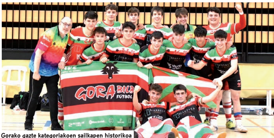
Gorako gazte kategoriako sailkapen historikoa

E statuko hitzorduetan gauza handirik egin ezin izan duten arren, Gorako gazteentzat, Otxartabeko kadeteentzat eta Eguzkiko haurrentzat aparta izan da kanpaina erregularra. Gorak bere multzoko bigarren postua lortu zuen gazte maila nazionalen, eta horrek Txapeldunen Kopa jokatzera eraman