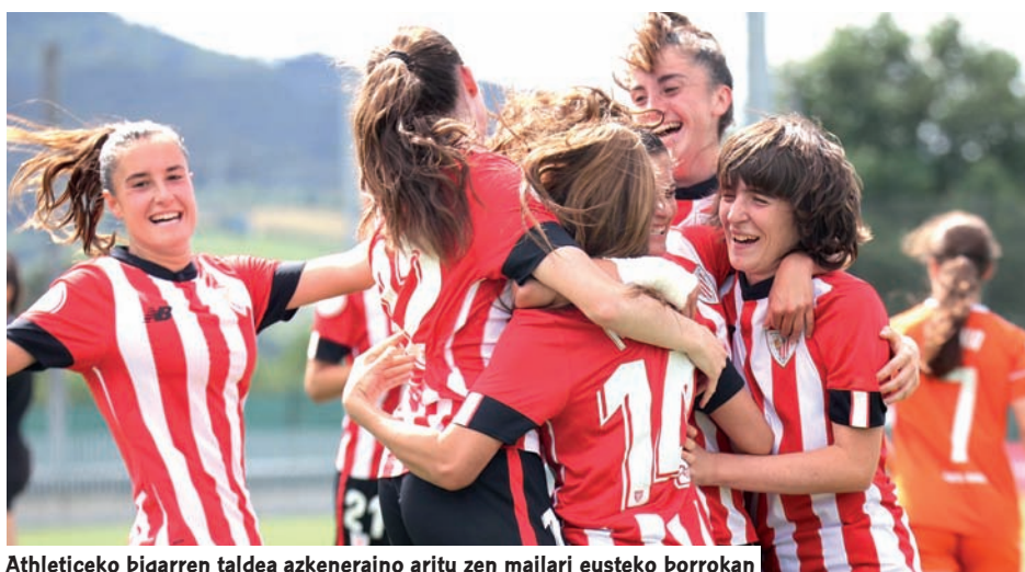
Athleticeko bigarren taldea azkeneraino aritu zen mailari eusteko borrokan