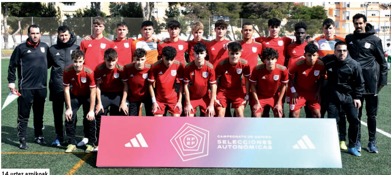
14 urtez azpikoak