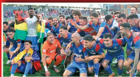
AMOREBIETA NAGUSITASUNEZ ITZULI DA BIGARREN MAILARA