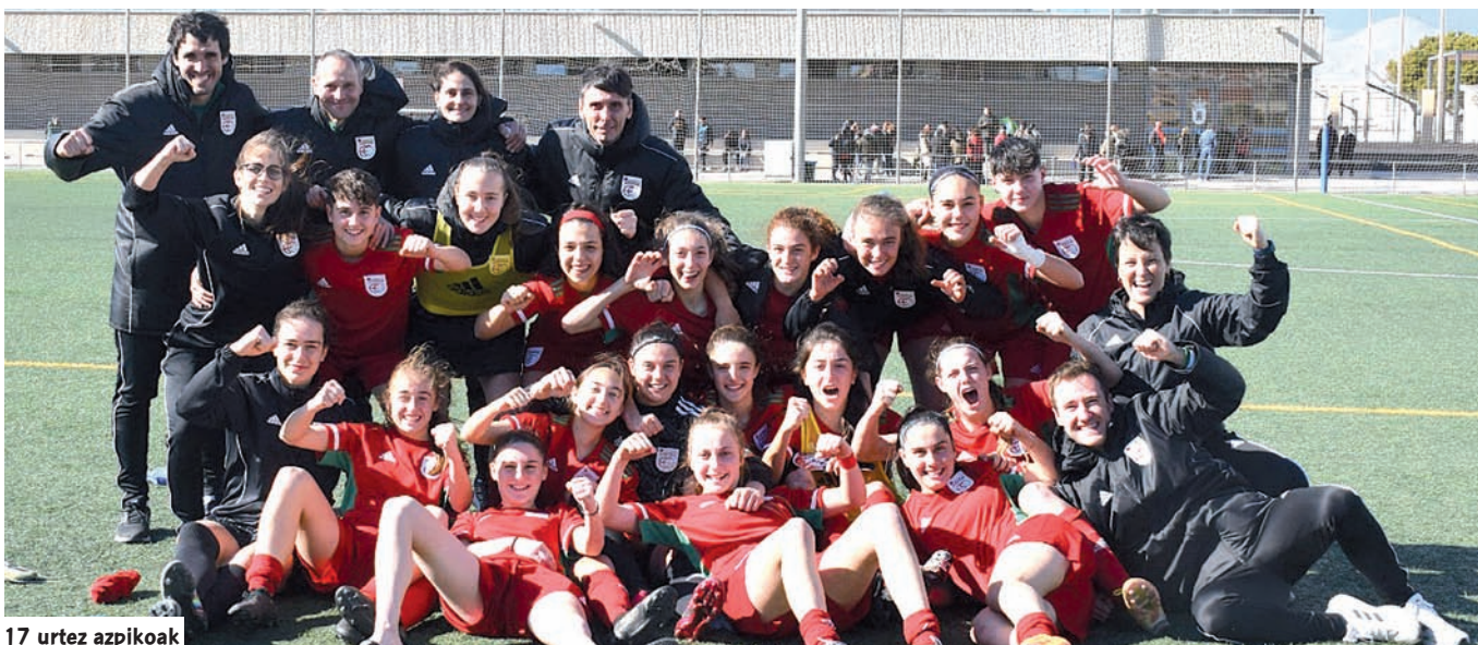
17 urtez azpikoak