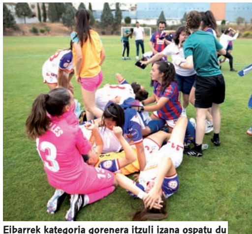
Eibarrek kategoría gorenera itzuli izana ospatu du

E ibarrek zerua jo du berriro. Ondo sufrituta eta azken hasperenera arte lan