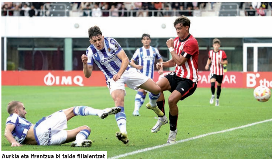
Aurkia eta ifrentzua bi talde filialentzat