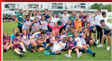
EIBARREKO EMAKUMEEN TALDEA KATEGORIA GORENERA ITZULI DA