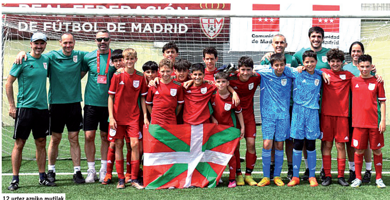
12 urtez azpiko mutilak