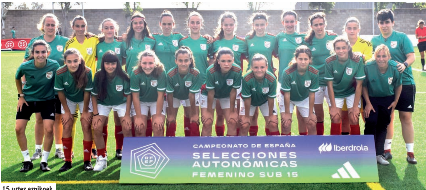
15 urtez azpikoak