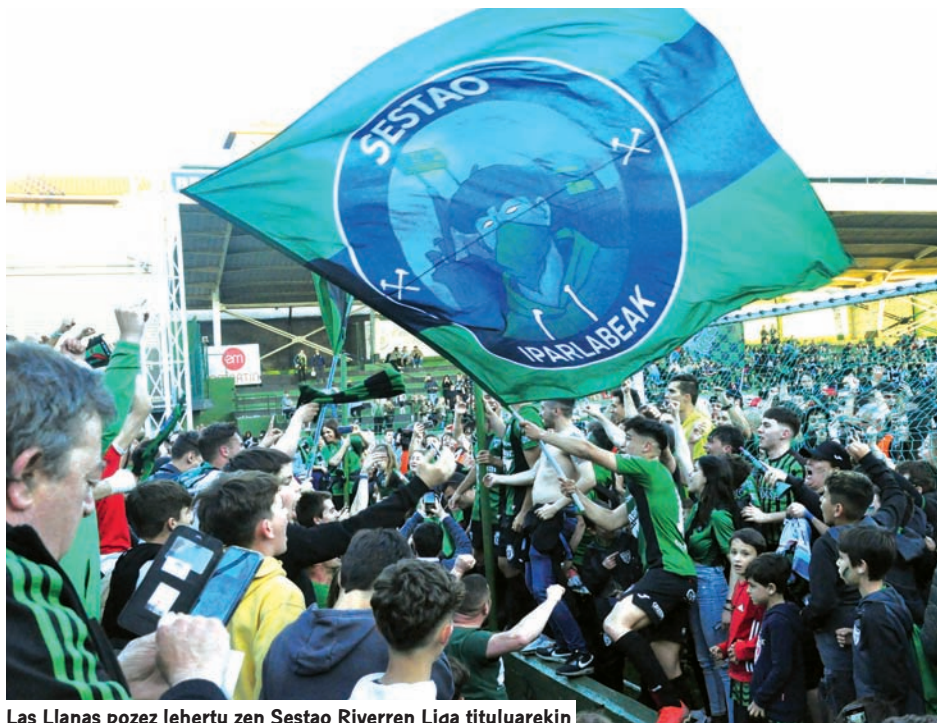
Las Llanas pozez lehertu zen Sestao Riverren Liga tituluarekin