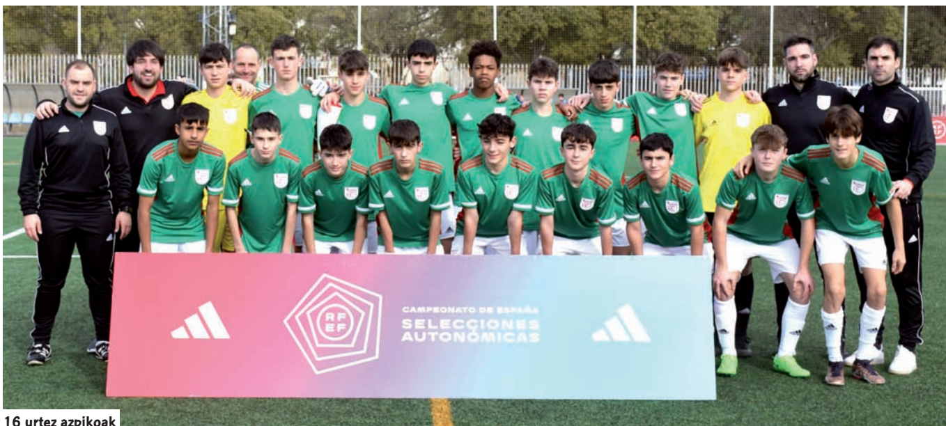
16 urtez azpikoak