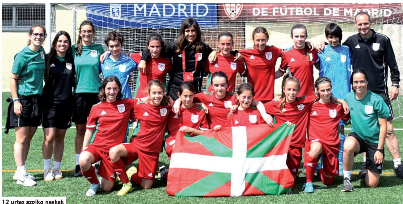
12 urtez azpiko neskak