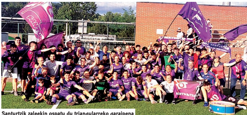
Santurtzik zaleekin ospatu du triangeluarreko garaipena

B easainek lurralde mailako txapeldunordeen play-offa hartu zuen eta Santurtzik lehen postuan bukatu zuen San Viatorri (2-0) eta Oiartzuni (2-1) irabazita. Hola, talde bizkaitarra hurrengo denboraldiko Errege Kopako atariko faserako sailkatu da. Santurtziarrek beren nagusitasuna baieztatu zuten Loizazeko instalazioetan jokatutako triangeluarrean, bi garaipen lortuta.