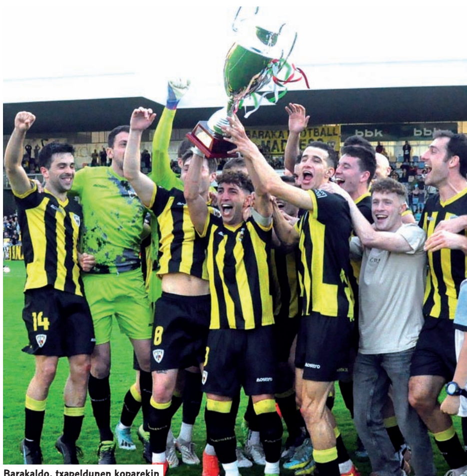
Barakaldo, txapeldunen koparekin

K anpaina honetan Federazioko 3. Mailan 16 talde lehiatu badira ere, Espainiako Futbol Federazioak onartu du datorren denboraldian multzo bakoitzean berriz ere 18 talde egotea, lehia areagotu dadin eta txapelketa luzatu dadin, zeren eta txapelketaren formatu erregularra apirileko hirugarren astean amaitu baita ikasturte honetan. Txapeliduna zuzenean igoko da, lau taldek play-offa jokatuko dute eta hiru jaitsi egingo dira.