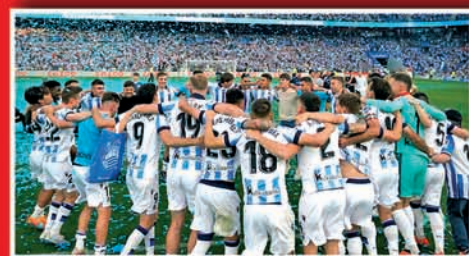
REALA TXAPELDUNEN LIGARAKO SAILKATU DA