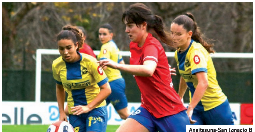
Anaitasuna-San Ignacio B

Por abajo, Lakua, Añorga, Anaitasuna, Leioako y Peña Athletic Santurtzi luchan por la permanencia, mientras que el Oiartzun B y el Arambizkarra están teniendo muchas complicaciones para sumar puntos.