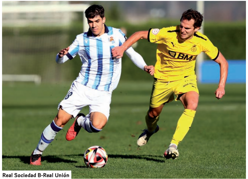
Real Sociedad B-Real Unión

El Real Unión, por su parte, se sitúa en una cómoda posición, aunque mirando siempre por el retrovisor a la zona de descenso. Cuatro descensos y un play out