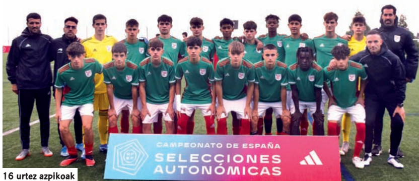
16 urtez azpikoak