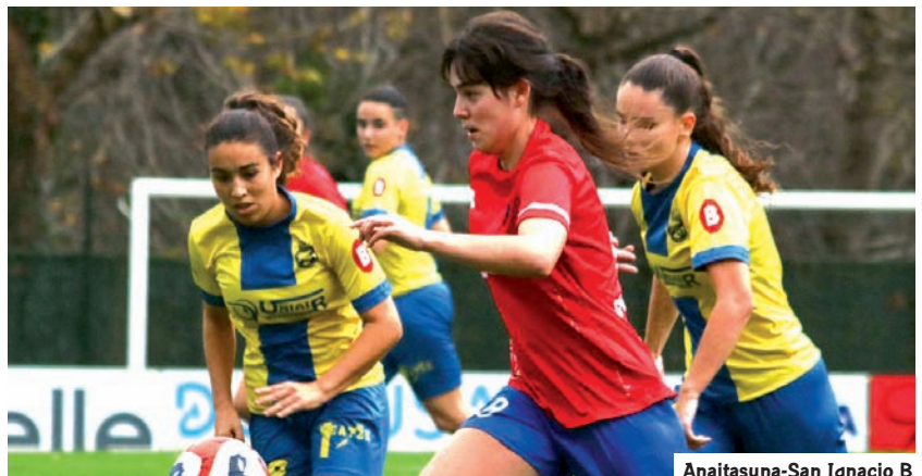
Anaitasuna-San Ignacio B

Behe aldean, Lakua, Añorga, Anaitasuna, Leioako eta Peña Athletic Santurtzi mailari eusteko borrokan ari dira, eta Oiartzun B eta Aranbizkarra, berriz, zailtasun asko izaten ari dira puntuak eskuratzeko.