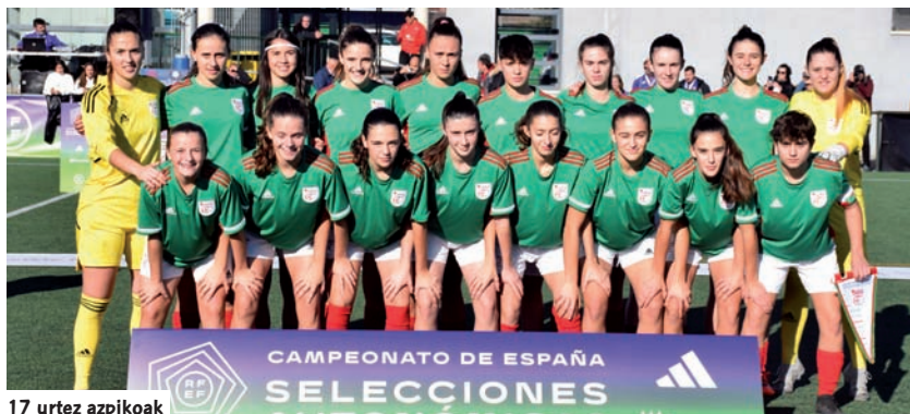
17 urtez azpikoak