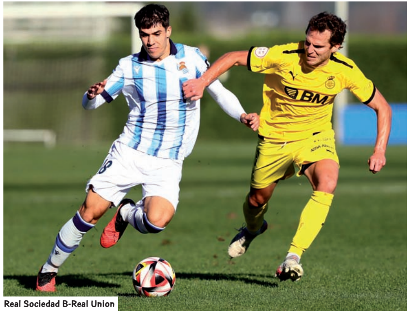
Real Sociedad B-Real Union

Real Union, bestalde, posizio erosoan dago, baina betiere atzerako ispilutik jaitsiera postuei begira. Lau jaitsiera eta play-out bat askotxo dira, eta Irungoek arrisku handiagoak saihestu nahi dituzte.