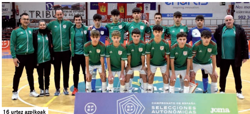
16 urtez azpikoak

Emaitza hori gorabehera, taldea altxatu egin zen bigarren jardunaldian Errioxari aurre egiteko.