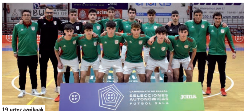
19 urtez azpikoak