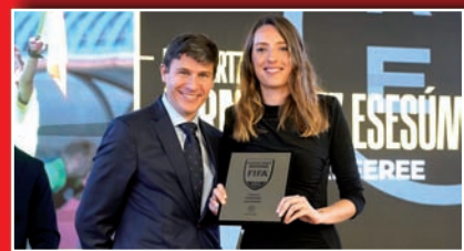
EUSKADIKO BATZORDEAK NAZIOARTEKO MARRAZAIN BERRIA DU