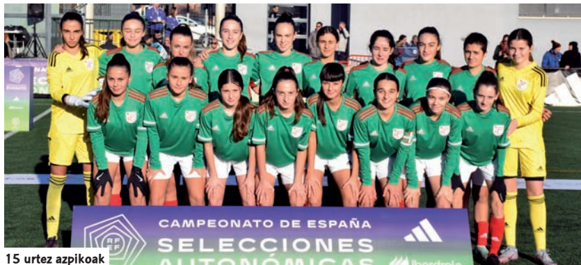
15 urtez azpikoak

Multzoko bigarren jardunaldian gure bi selekzioek Kanariar Uharteetako taldearen aurka jokatu zuten. Kanariarrek debuta egin zuten txapelketan. 15 urtez azpikoak ez ziren aurkaria gaitzitzeko gai izan. Makina bat aukera sortu zituen neurketa osoan, baina ezin izan zituen gauzatu. 0-0 berdinduta, gure taldeak lau punturekin bukatu zuen bere parte hartzea.