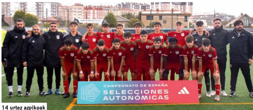
14 urtez azpikoak