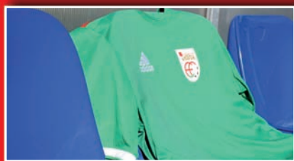
EUSKAL SELEKZIOAREN ELASTIKO BERRIA AURKEZTUA